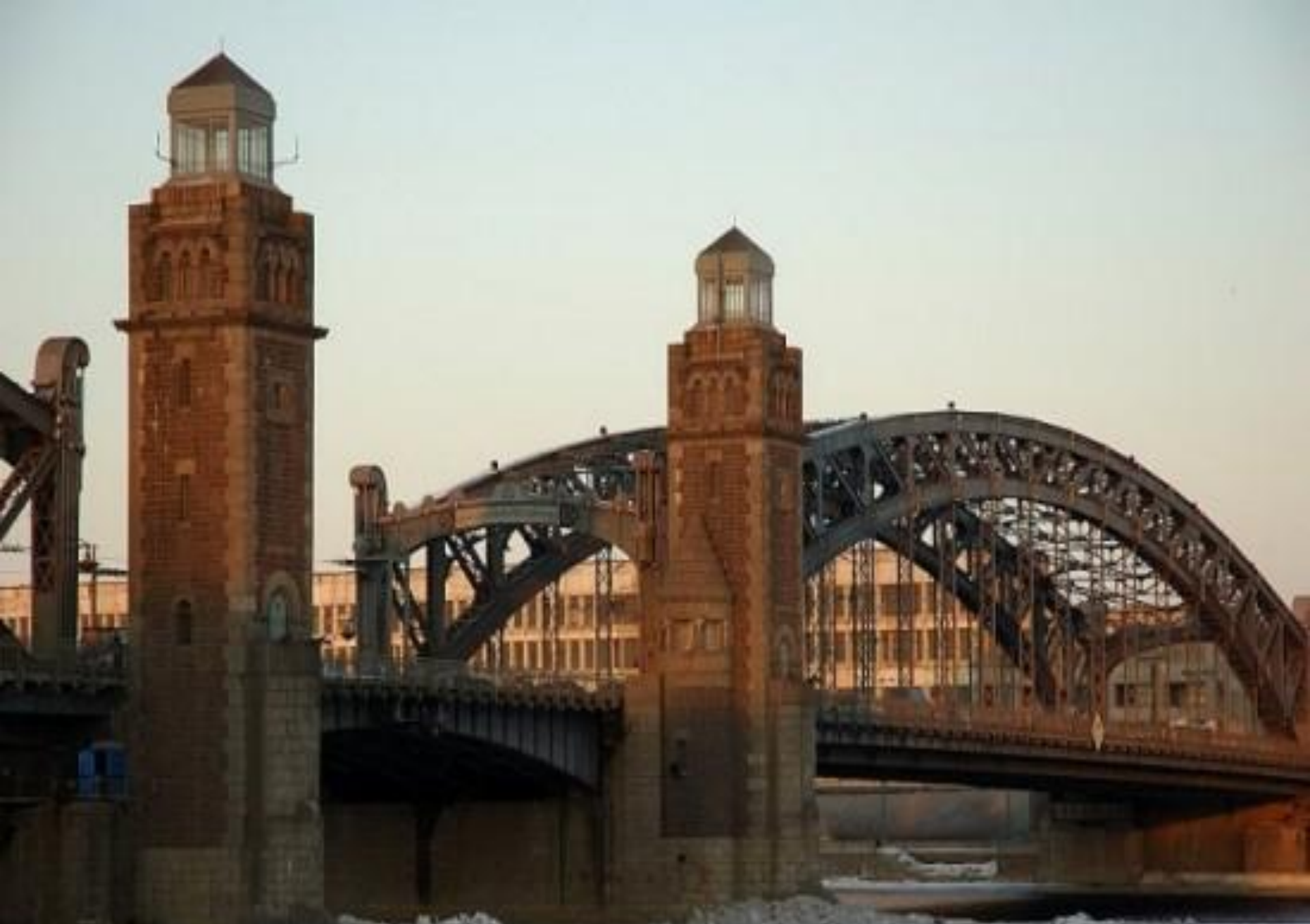
Мост Петра Великого