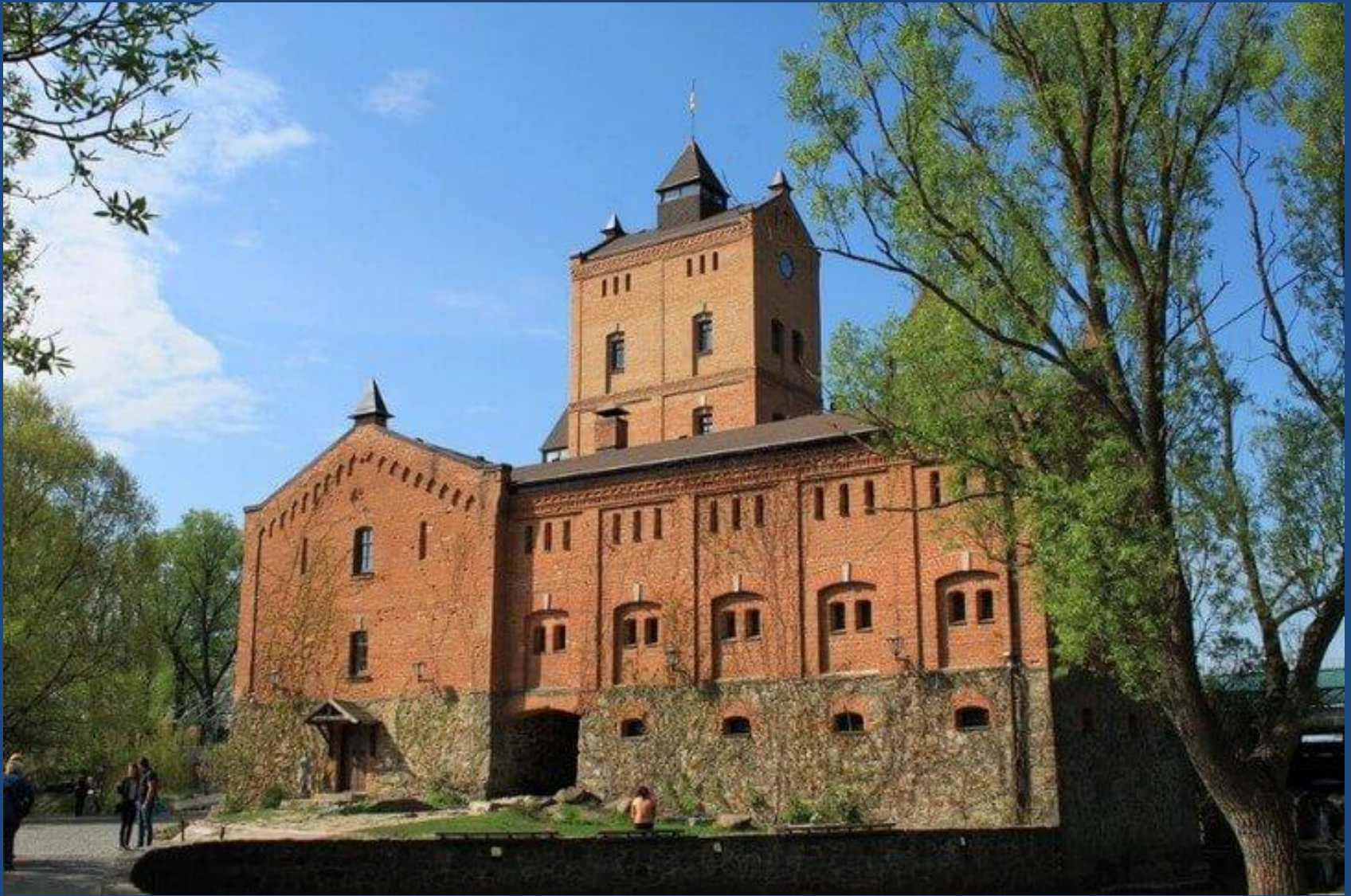
• Замок Радомысль