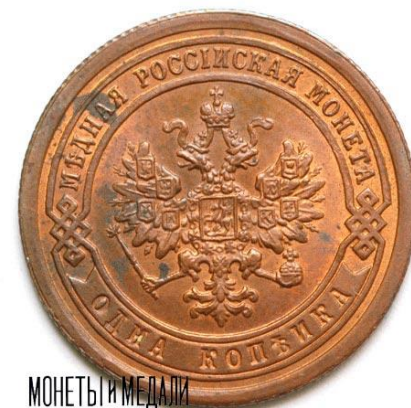
МОНЕТЫ И МЕДАЛИ копейка из меди