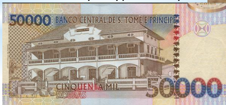
памятники культуры и искусства