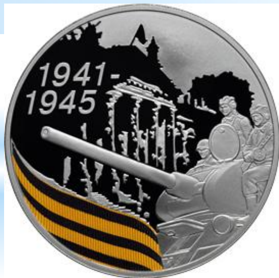
значимые моменты истории