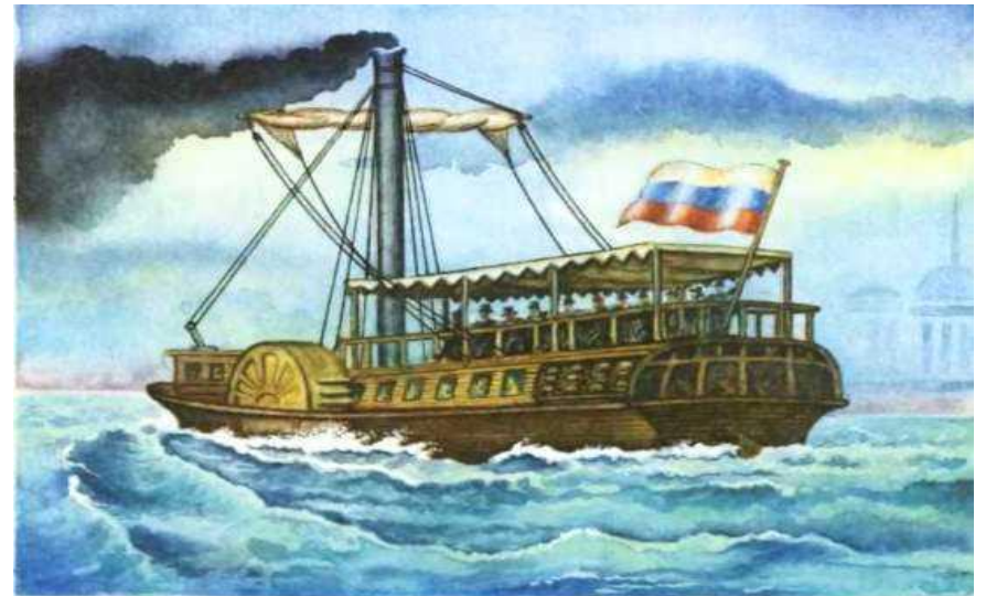
Пароход «Елизавета» Россия, 1815 год

Судно, приводимое в движение паровой машиной или турбиной.