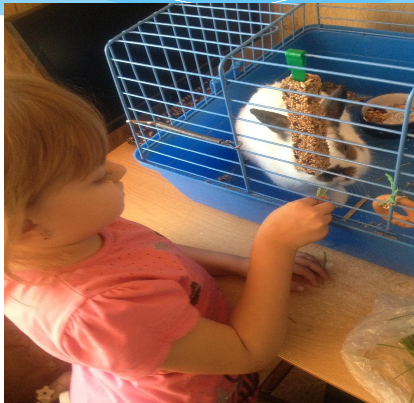
Я со своим кроликом Кузей