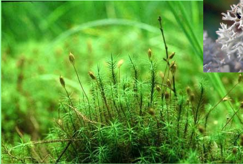
Мох кукушкин лён