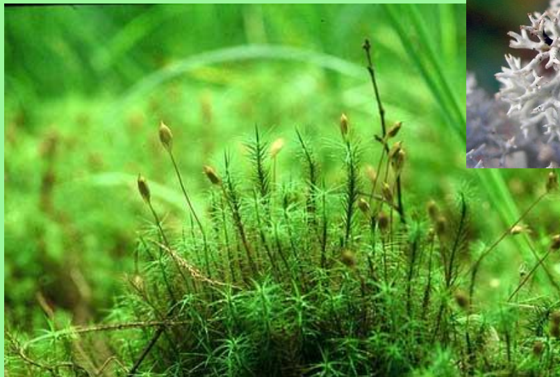
Мох кукушкин лён