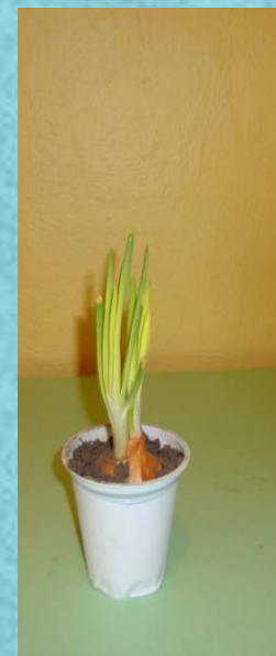
В тёмном месте