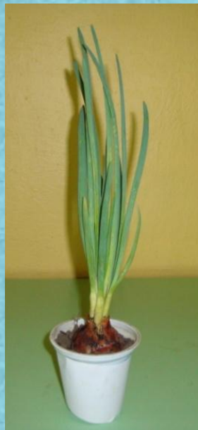
На подоконнике с поливом