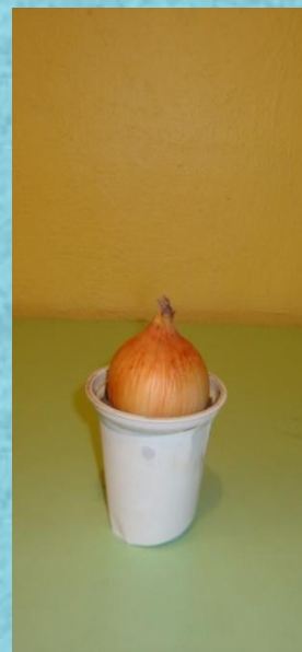
В холодном месте