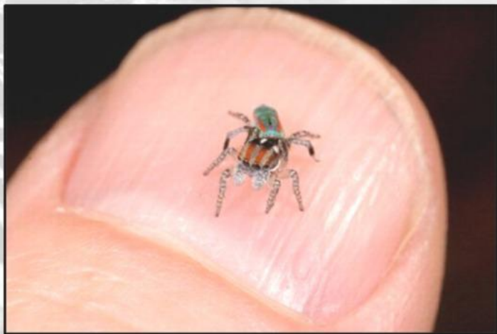
Самый маленький паук в мире Patu digua, его длина составляет всего 0,37 мм. Обитает в Колумбии, Южная Америка