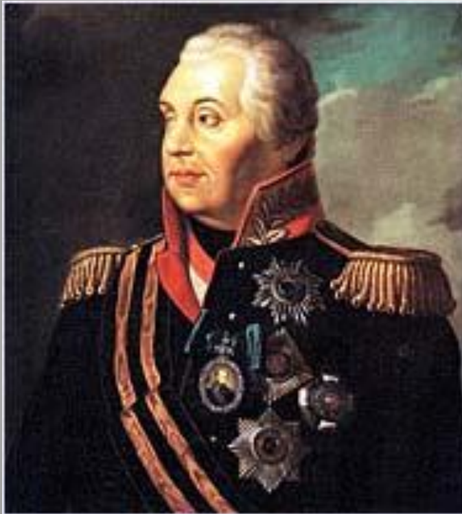
М. И. Кутузов. Художник Н. Яш. 1883.

Михаил Илларионович Кутузов происходил из старинного дворянского рода. 12 – летний Михаил был зачислен капралом в Соединённую Артиллерийскую и Инженерную дворянскую школу.