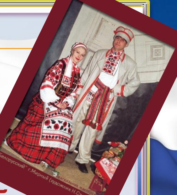
Театральная мастерская "Белорусский" г.Мирный (художник Н.Студенова)