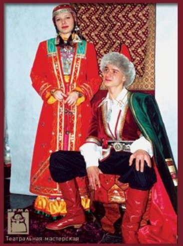
Театральная мастерская "Башкирский" г.Мирный (художник Н.Студенова)