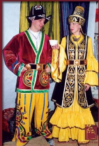
Театральная мастерская "Кавказский" г.Мирный (художник Н.Захарова)