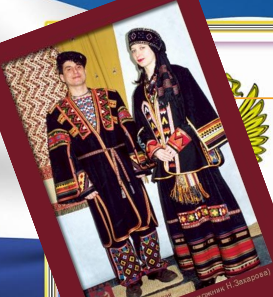
Театральная мастерская "Грузинский" г.Мирный (художник Н.Захарова)