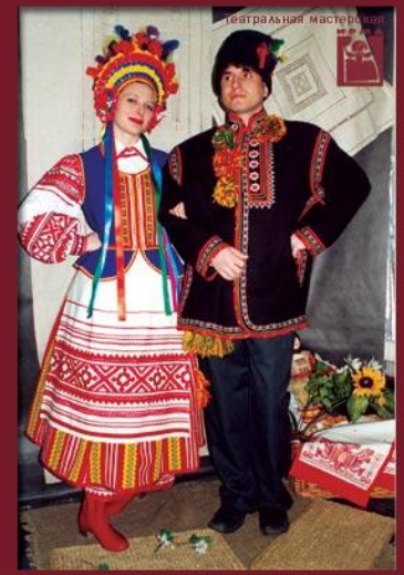
Театральная мастерская "Украинский" г.Мирный (художник И.Иларионова)