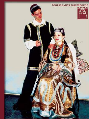
Театральная мастерская "Татарский" г.Мирный (художник Н.Захарова)