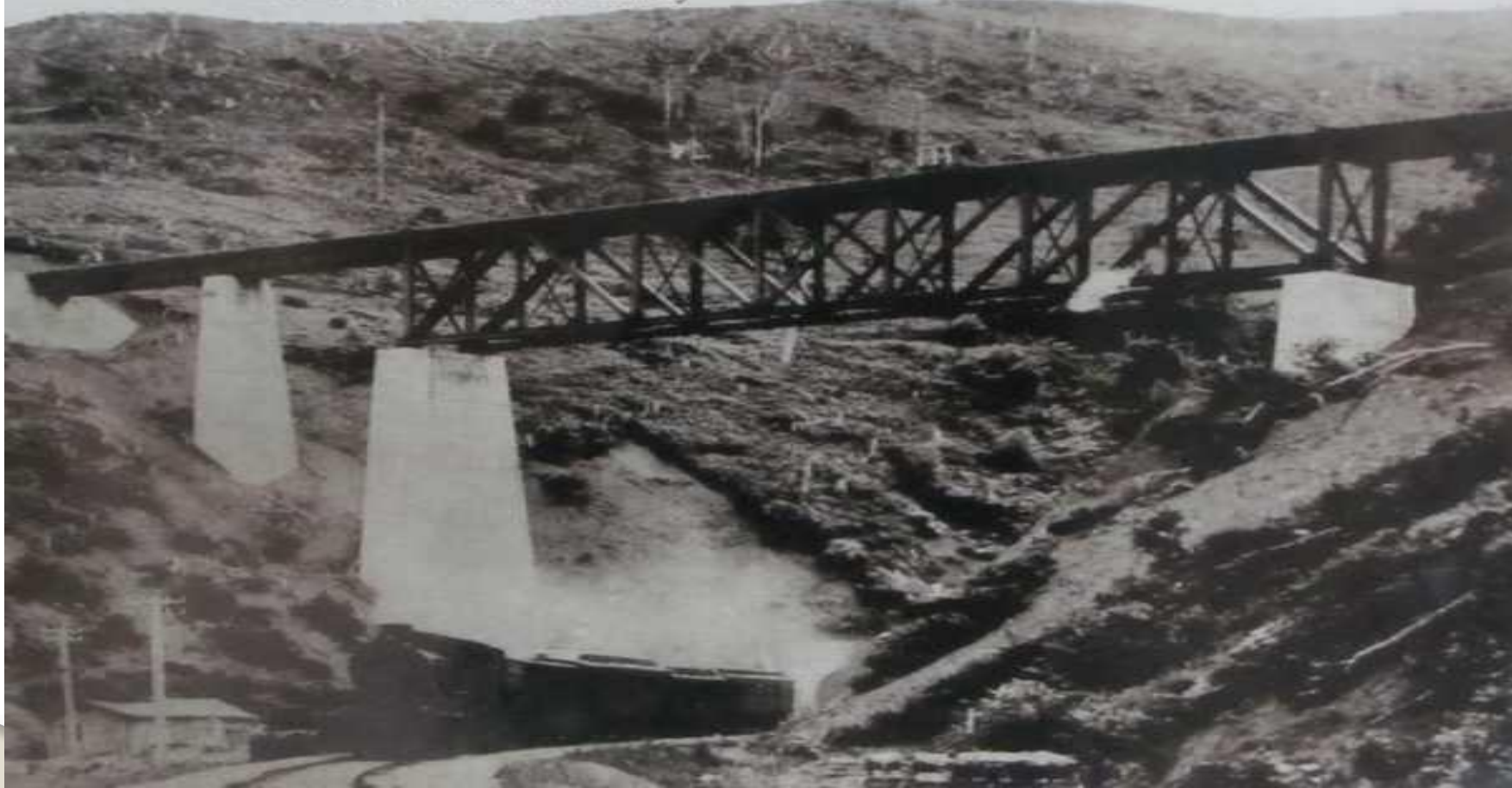
(棒 太) 豊真鐵道ループライン線(真岡附近) Roove-line of Maoka sailway

Мост был построен в 1928 году японцами. Эта часть пути была самая сложная, на пути стояли горы, леса и реки. Мост должен был соединить Тоёхару и Маока - Южно-Сахалинск и Холмск. ● Этим фотографиям более 80 лет.