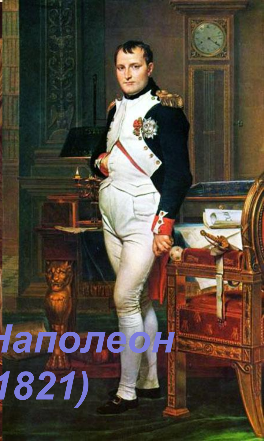
Бонапарт Наполеон (1769 - 1821)