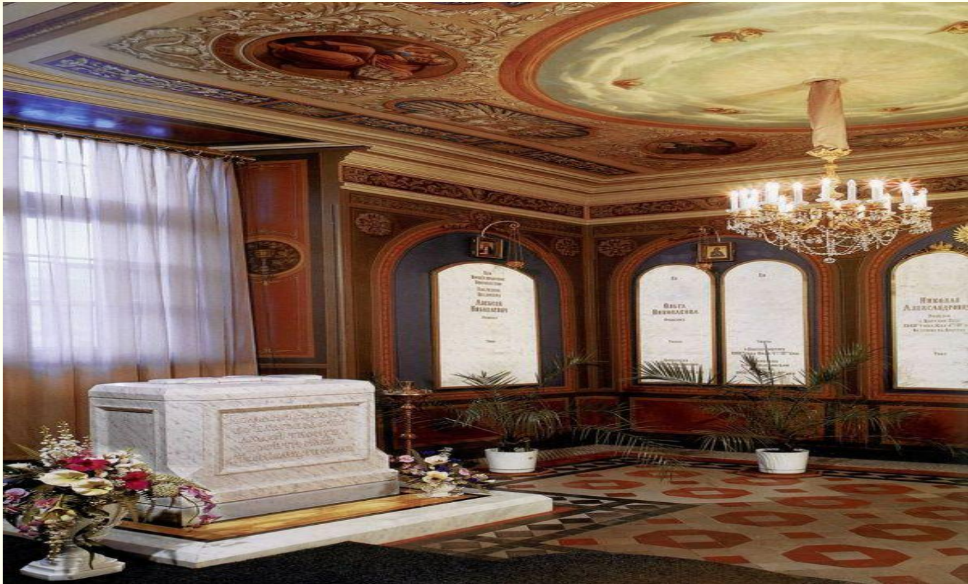
Захоронение семьи последнего русского императора Николая II.