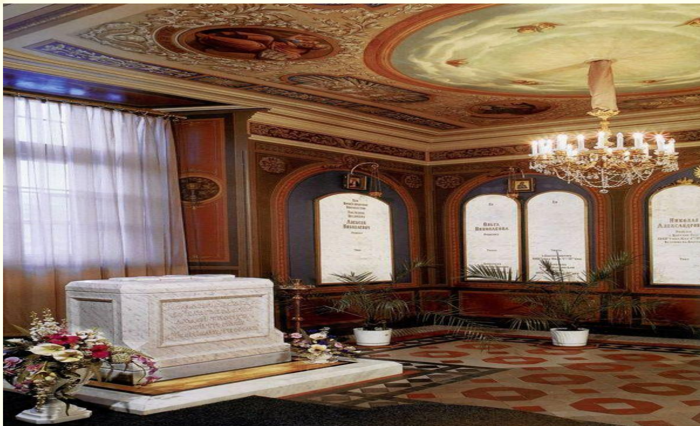
Захоронение семьи последнего русского императора Николая II.