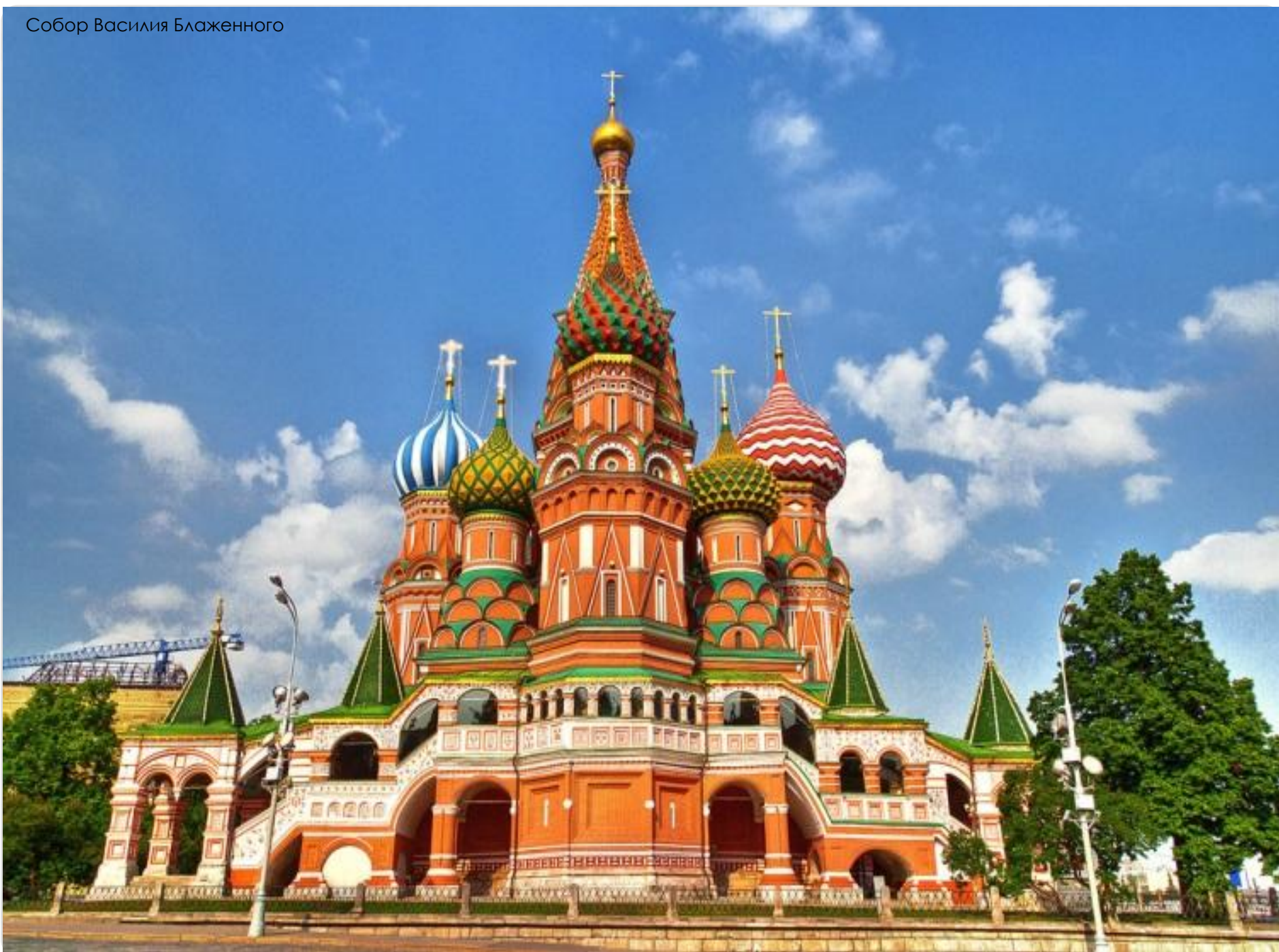
Собор Василия Блаженного