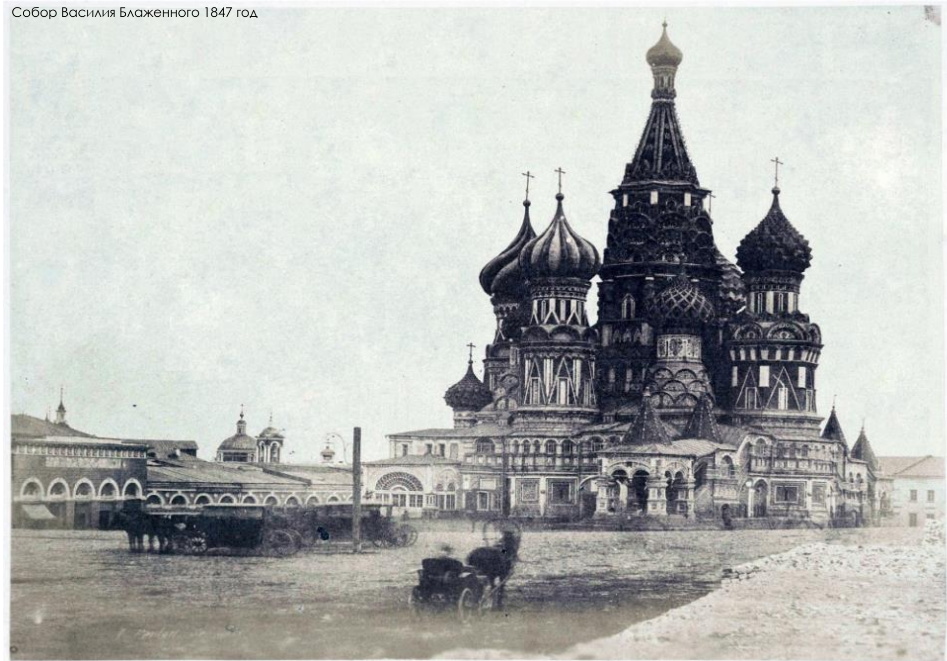
Church of St. Vasile, Moscow. Taken from the summer court showing entrance.