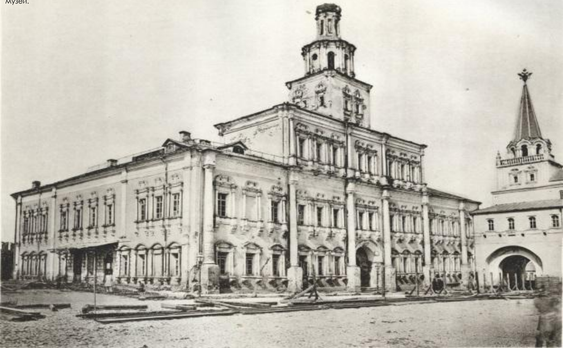
Древнее здание, въ которомъ былъ въ 1755 году открытъ Московскій Университетъ.

Ещё на Красной площади когда-то стояло здание Земского приказа, оно же – здание Главной аптеки и первое здание Московского университета. Но в 1874 году его разобрали, а на его месте построили Исторический музей.