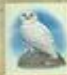
К. Г. Г. Г.