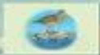
К. Г. Г. Г.