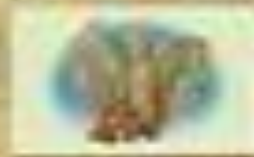
К. Г. Г. Г.