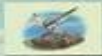
К. Г. Г. Г.