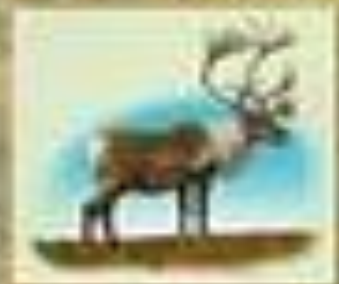
К. Г. Г. Г.