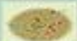
К. Г. Г. Г.