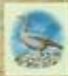
К. Г. Г. Г.