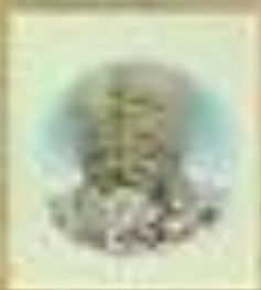
К. Г. Г. Г.