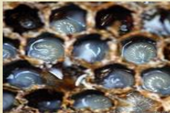
Перга (пчелиный хлеб)