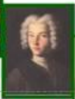
Петр II 1727-1730