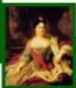
Екатерина I 1725-1727