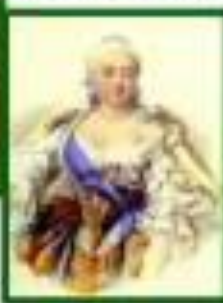
Елизавета Петровна 1741-1761