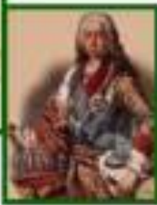
Петр III 1761-1762