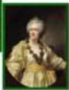
Екатерина II 1762-1796