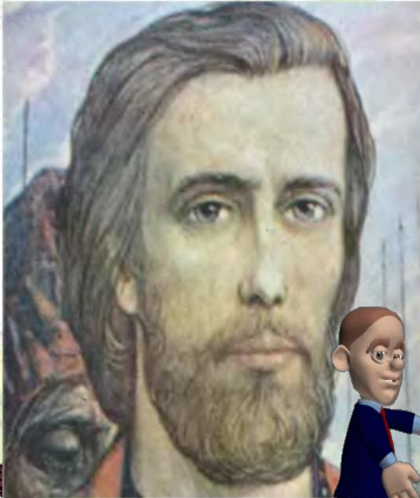
Князь Дмитрий Иванович картины Ильи Глазунова