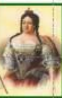
Анна Иоанновна 1730-1740