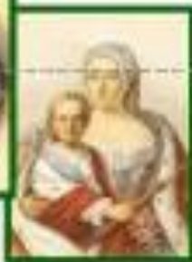
Иван VI Антонович и Анна Леопольдовна 1740-1741