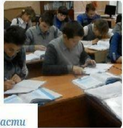
МКОУ Поповская СОШ Россошанского муниципального района Воронежской области