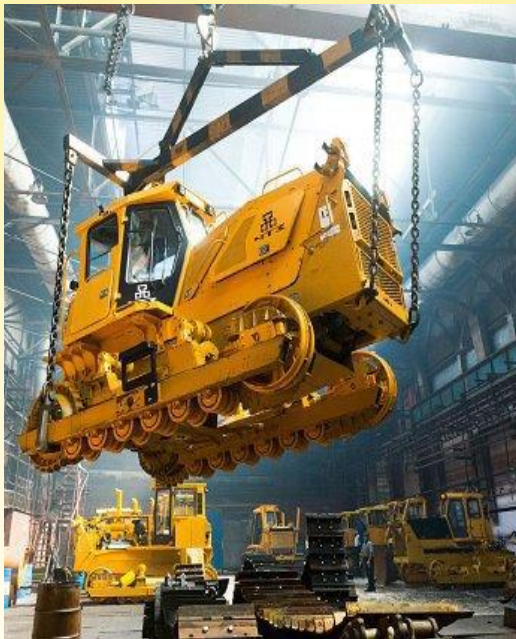
Челябинский тракторный завод (ЧТЗ-УРАЛТРАК)