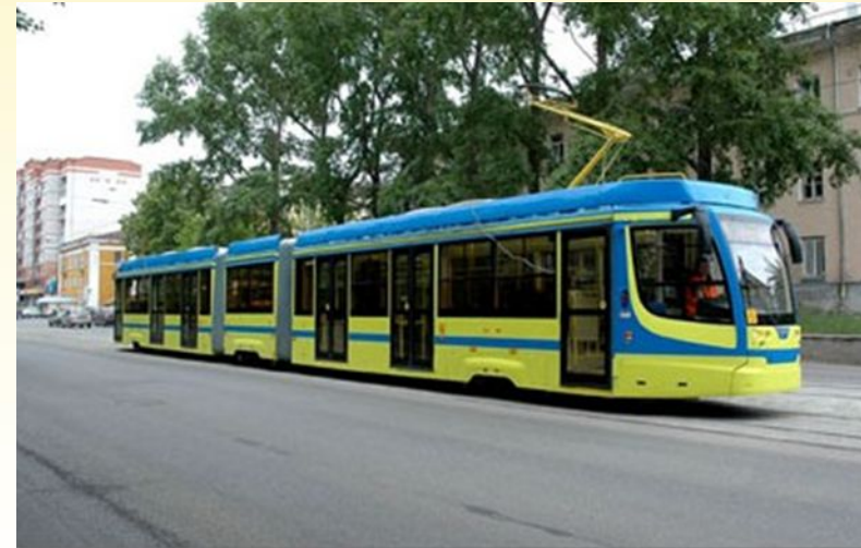
Усть-Катавский вагоностроитель ный завод (УКВЗ)