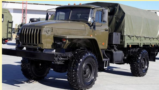
Уральский автомобильный завод (УралАЗ) (г. Миасс)