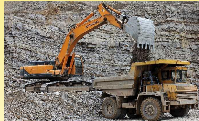
Биянковский щебёночный завод