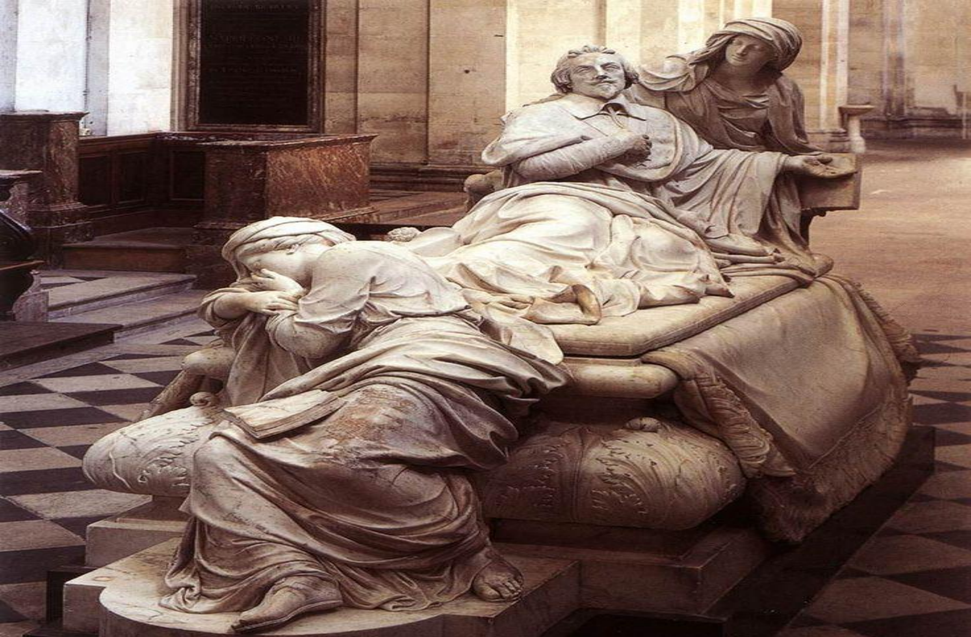
Могила кардинала Ришелье