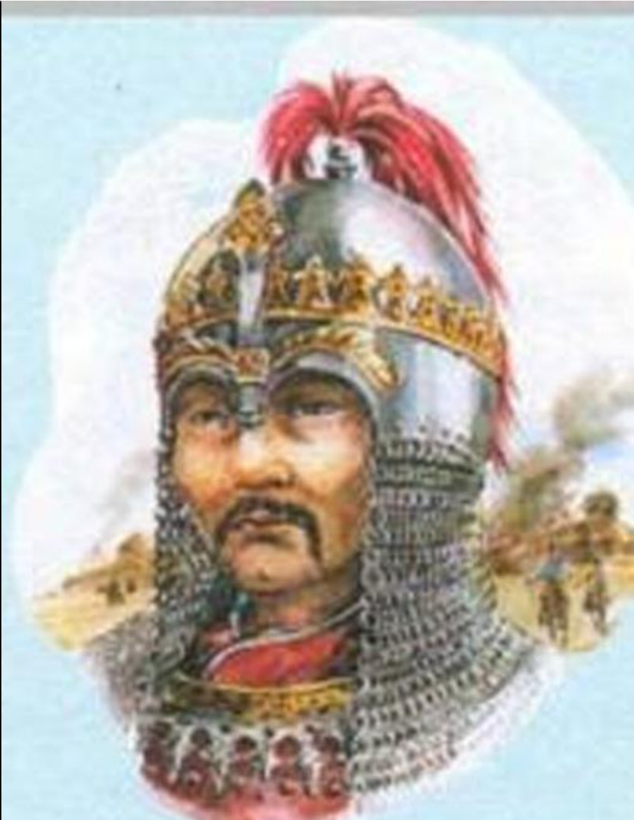
Мамай (? — 1380)