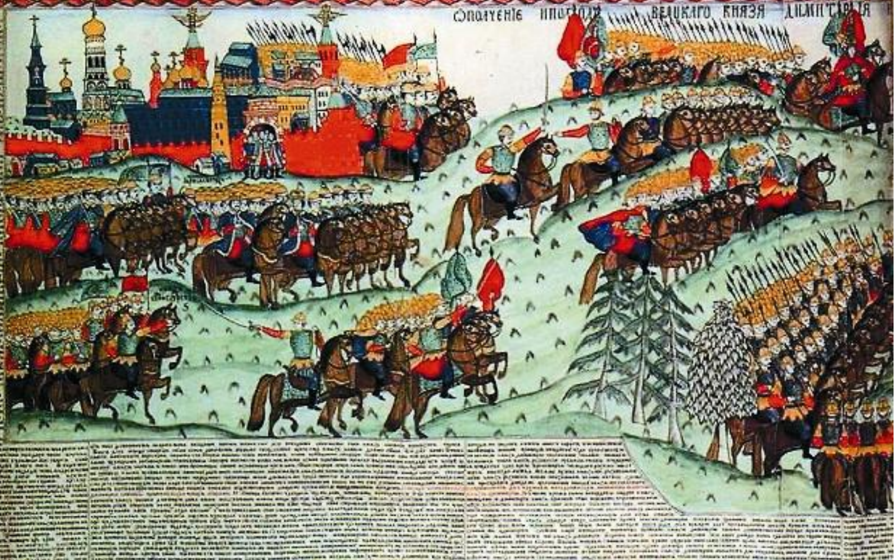
Численность русского войска достигала 100 – 150 тысяч человек.

ОПОУЕНІЕ ППОТІА ВЕЛІКАГО КНЯЗЯ ДІМІТІА ІА