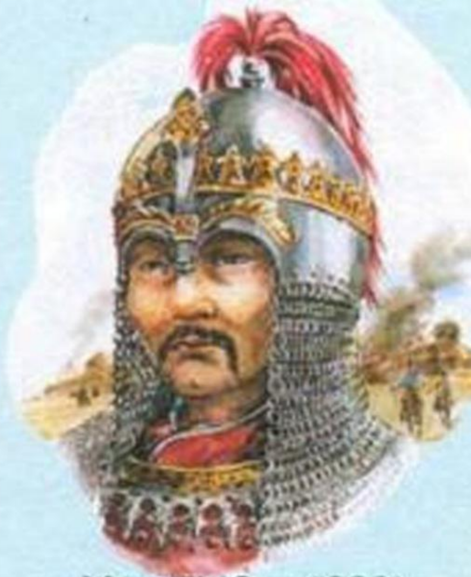
Мамай (? — 1380)

Летом 1380 года, собрав почти все силы Орды, хан Мамай подошёл к южным границам Рязанского княжества.