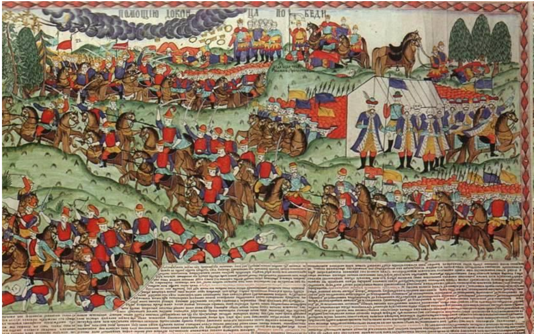
Столько же было и у Мамая.