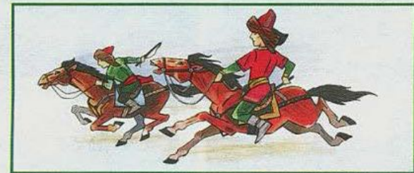
Конские скачки — одно из любимых состязаний башкир во время народных праздников