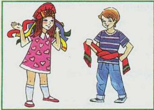
Повязка с лентами и пояс-кушак — части русского костюма