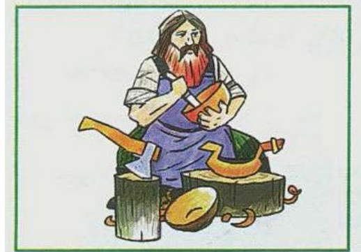
Резьба по дереву — одно из традиционных занятий у народа чуваши