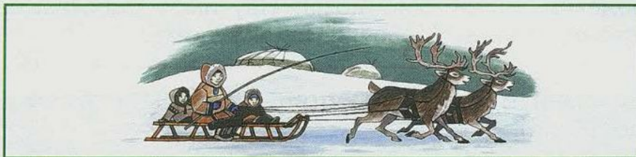
Оленья упряжка — традиционный транспорт чукчей