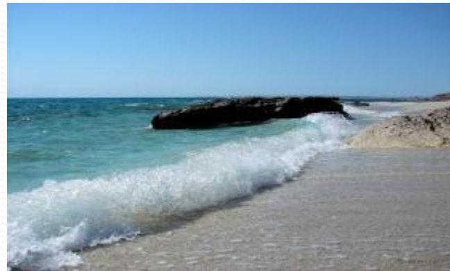
Каспийское море (самое большое)