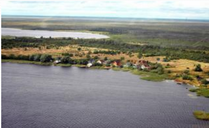
Байкал (самое глубокое)