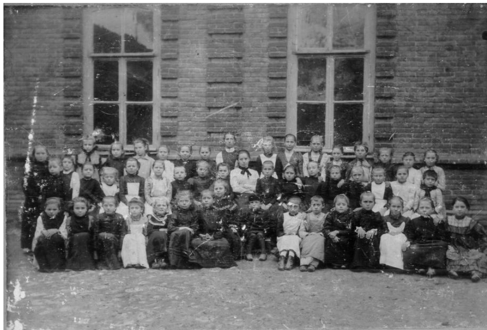
Первый класс Минераловодского железнодорожного женского училища, 1903 г.

В 1900 г. жители посёлка увидели построенное мужское двухклассное железнодорожное училище. В 1902 году на станции открывают двухклассное женское училище в дополнение к одноклассному, которое уже существовало при мужском училище. Срок обучения в одноклассном училище четыре года, в двухклассном – шесть.