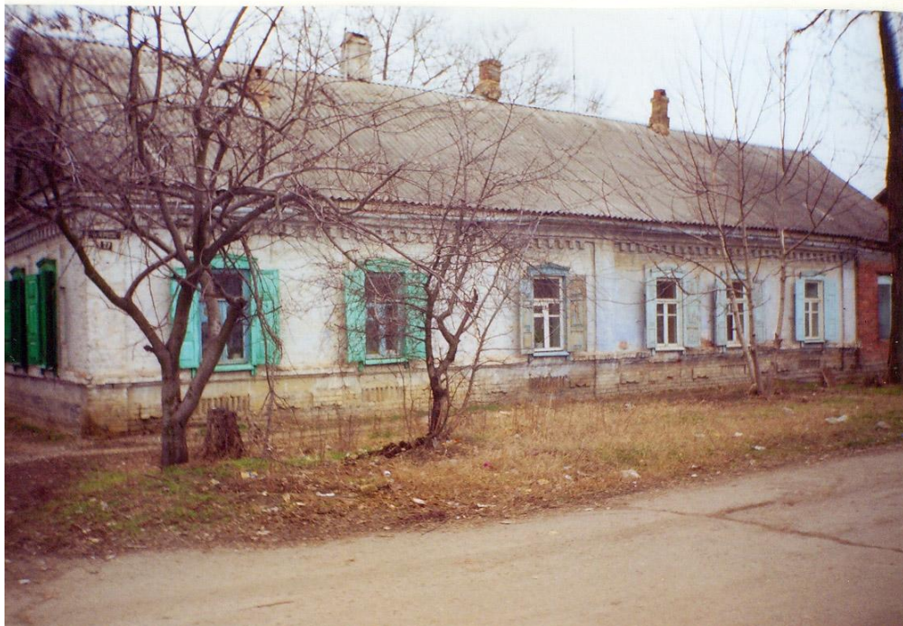
Доходные дома (ныне ул. Фрунзе, 27)

Улица Пушкина называлась Атаманской. Она была сплошь застроена «доходными домами» на 5-8 квартир. Жили здесь в основном железнодорожники, отдавая за квартиру большую часть своего заработка.