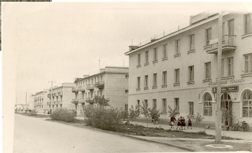
Проспект К. Маркса в 70-е годы.