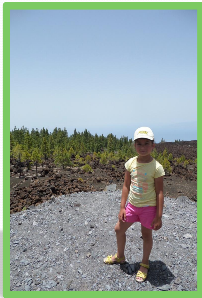
Сосновый лес у вулкана Тейде . Остров Тенерифе.