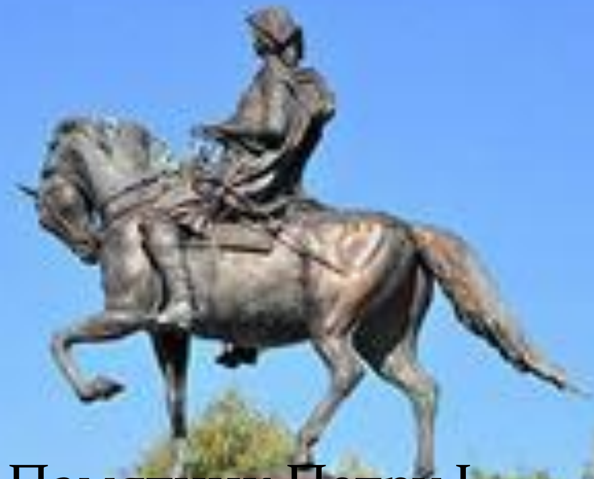
Памятник Петру I