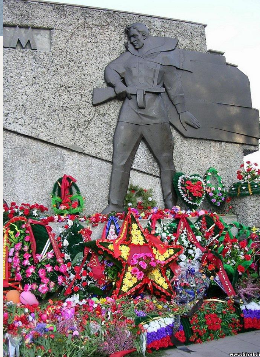
Мемориал павшим воинам в Великой Отечественной войне