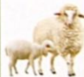
ОВЦА С ЯГНЁНОМ