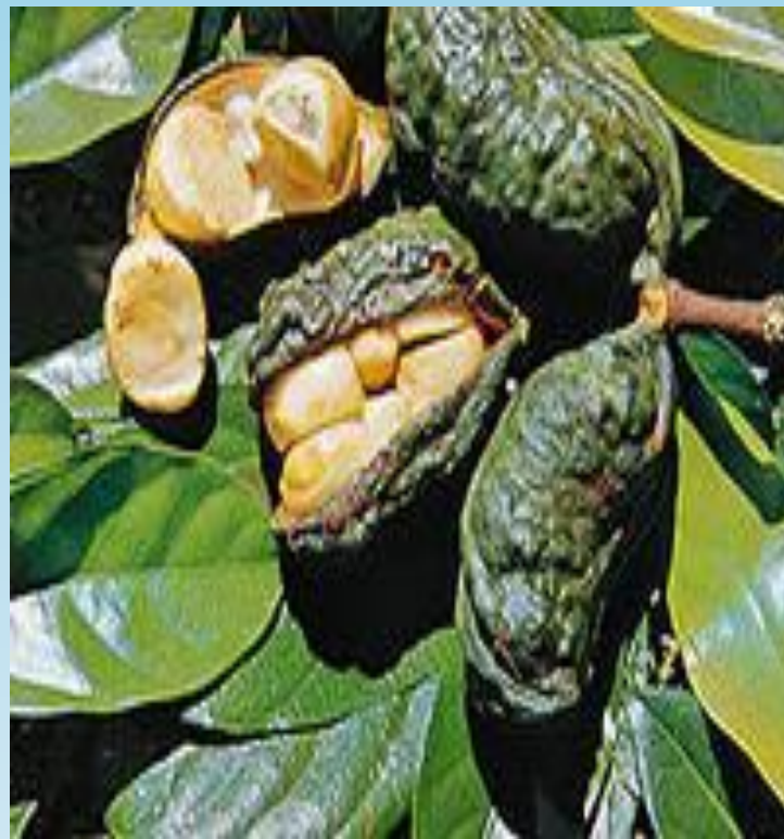
АФРИКАНСКИЙ ОРЕХ КОЛА