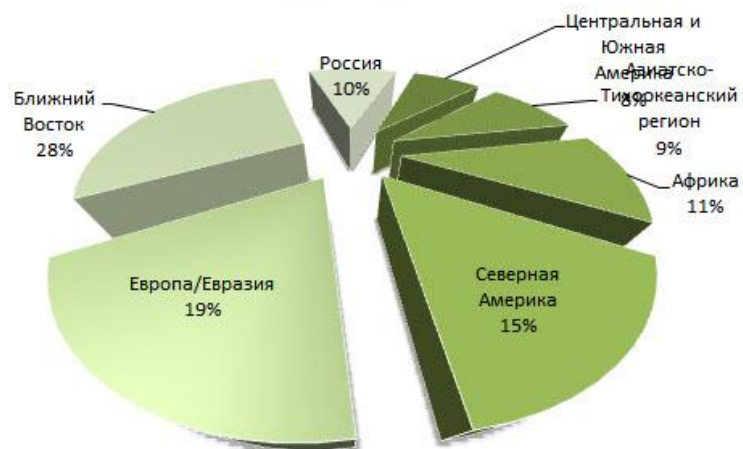
Добыча нефти (млн. баррелей в день)