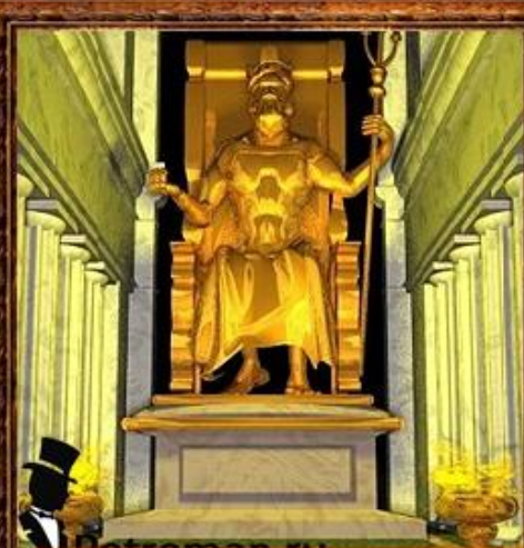
Статуя Зевса в Олимпии.