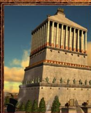
Мавзолей в Галикарнасе.