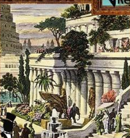
Висячие сады Семирамиды.