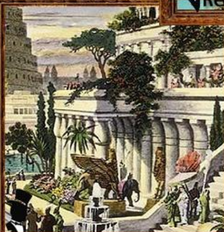
Висячие сады Семирамиды.