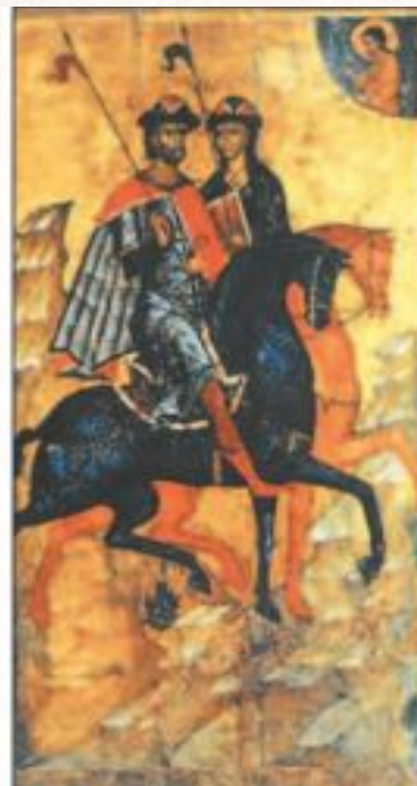
Икона «Борис и Глеб»