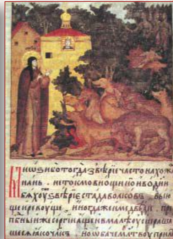
Кирилл и Мефодий

ІЗЪ А ВЪКИ Б ВЪДИ Б ГАГОЛЬ Г ДОБРО Д ЁСТЬ Е ЖИВѢТЕ Ж ЗЪЛО С ЗЕМЛѦ З ЙЖЕ Н КѦКѦ К ЛЮДИ Л МЫСЛѢТЕ М НАШЪ Н ОНЪ О ПОКОЙ П РЦЫ Р СЛОВО С ТВЕРДО Т ЙКЪ У ФЕРГЪ Ф ХЪРЪ Х ОТЪ Ѡ ЦЫ Ц ЧЕРВЪ Ч ШѦ Ш ЦѦ Щ ЁРЪ Ъ ЁРЫ Ш ЁРЬ Ъ ІАТЬ Ћ ЮСЪ Ж КСИ Ѫ ПСИ Ѯ ДИТѦ Д ЙЖИЦА В