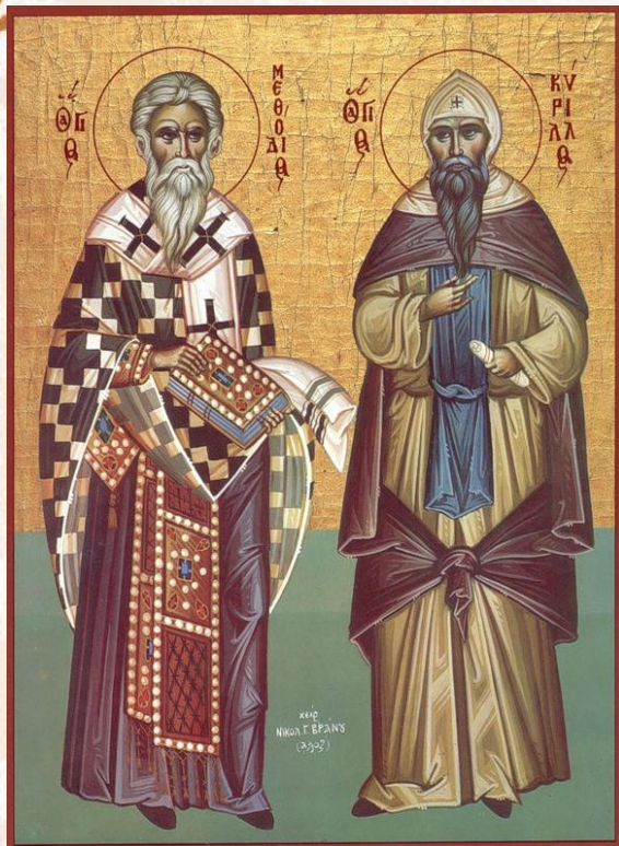
Кирилл и Мефодий