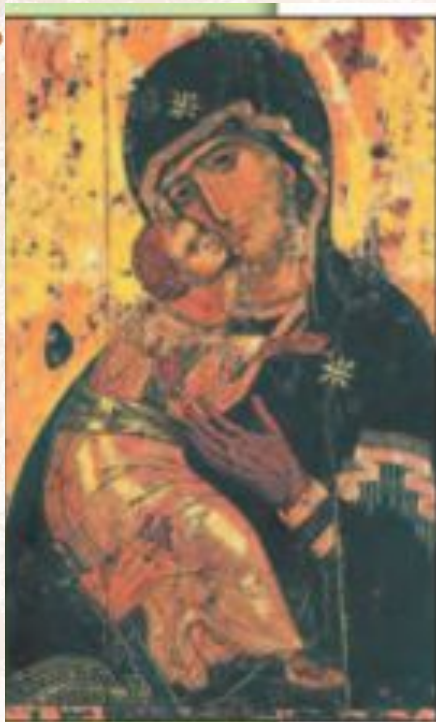
Икона «Богоматерь Владимирская»