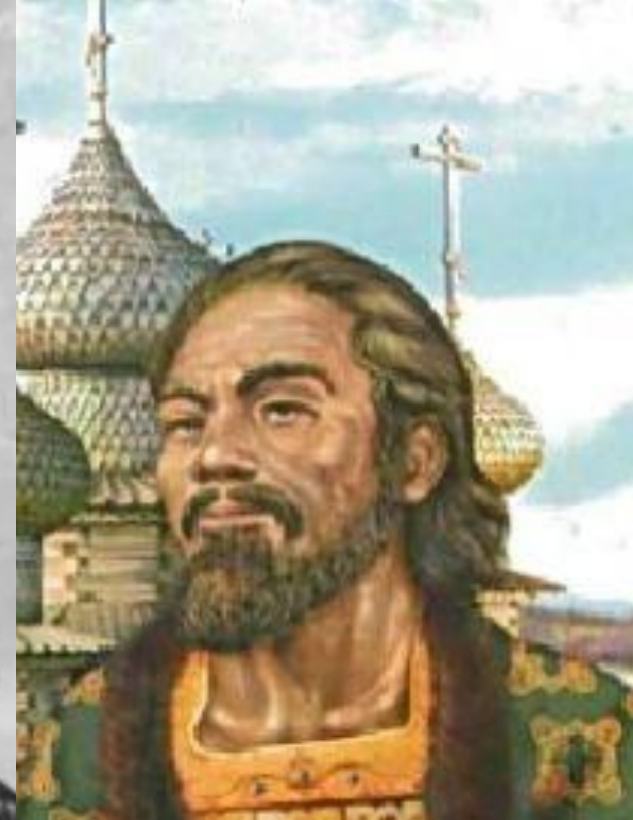
Князь Андрей Боголюбский