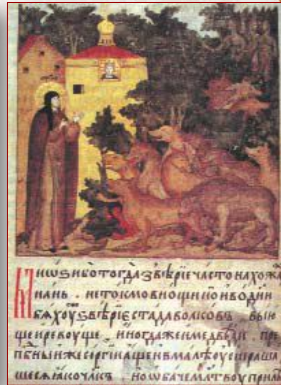
Рукописная книга времен Древней Руси