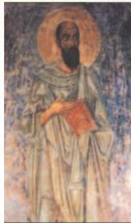
Фреска «Апостол Павел»