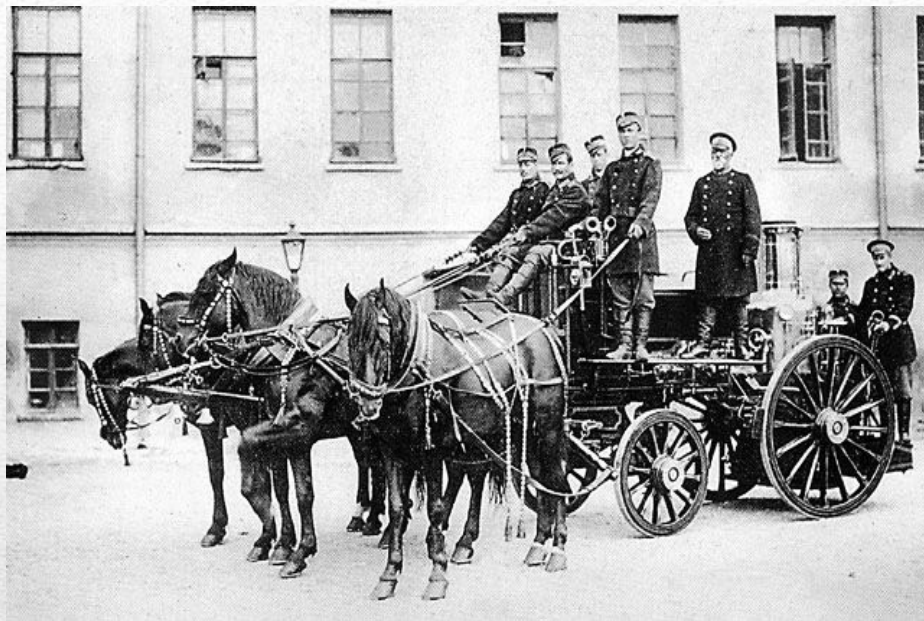
Пожарная охрана 1900год.