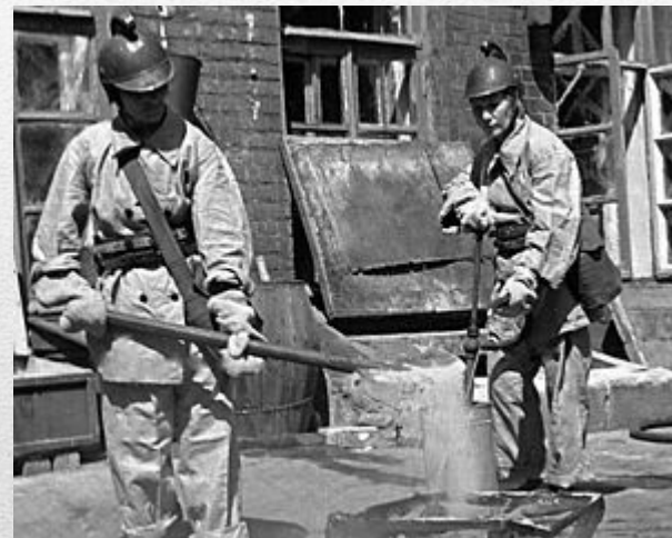
Боевой расчет тушит немецкие зажигательные авиабомбы.

В годы Великой Отечественной Войны пожарная охрана стала своеобразным щитом, обороняющим от огня военные объекты, населенные пункты. В первые месяцы войны основную тяжесть борьбы с пожарами, возникавшими при налетах вражеской авиации, пришлось выдерживать городским профессиональным пожарным командам. Многие огнеборцы сражались с врагом в партизанских отрядах. В самых тяжелых условиях в таких городах-героях, как Ленинград, Сталинград, Смоленск, Севастополь, Одесса, пожарные были непосредственно в бою. Они были родом войск, который принес огромную помощь Красной Армии. В летописях пожарной славы записаны сотни и сотни имен героев, дела которых являются поучением для новых поколений пожарной охраны.