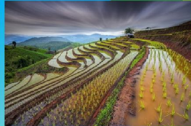
Рис – это растение семейства злаков, относящееся к крупяным культурам. Зрелое рисовое растение может достигать 1-6 метров в высоту. Появился рис на нашей планете более 5 тыс. лет назад до нашей эры на территории Китая. Этот символ жизни и плодородия был завезён на запад Александром Македонским и затем получил широкое распространение.