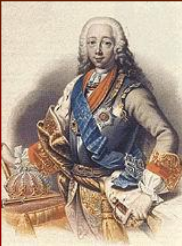
Император Пётр III (супруг Екатерины)