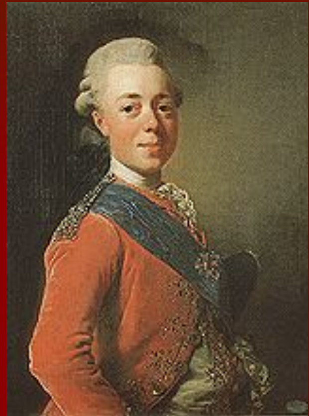
Сын императрицы Павел Петрович