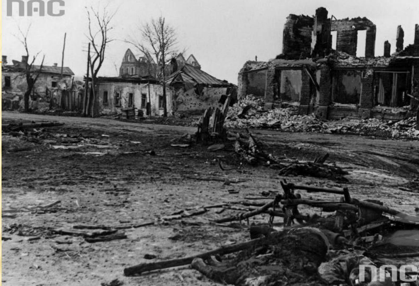
Narodowe Archiwum Cyfrowe, sygn. 2-1654

На улицах и площадях Белгорода гитлеровцы оставили более 3000 трупов солдат и офицеров. Саперы обнаружили и обезвредили в городе 50000 немецких мин.