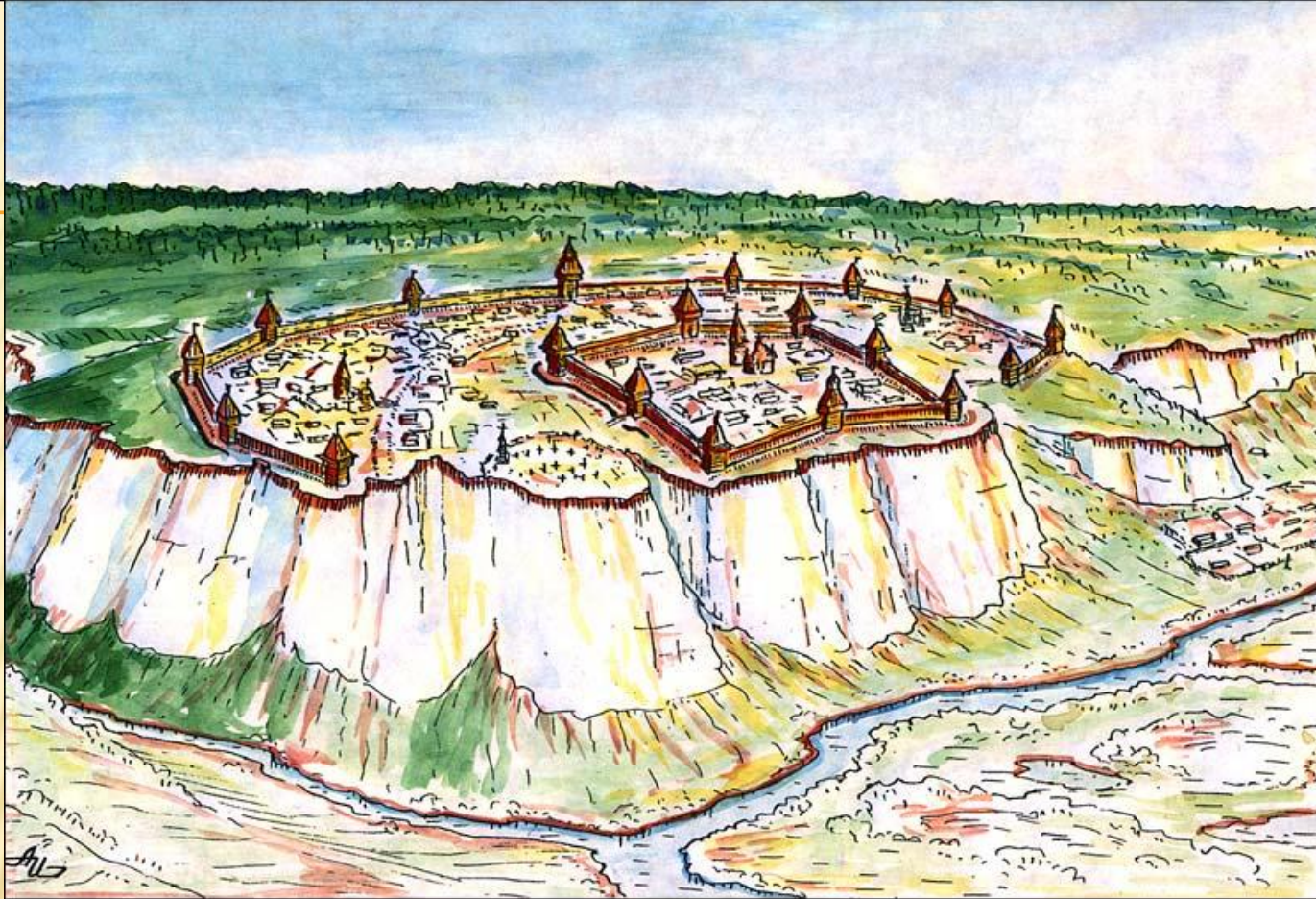
Белгородская крепость на Меловой горе. Рис. Ильин А. И.

Белгород возник на месте Северского городища , расположенного на меловой горе, что поднялась над Северским Донцом близ устья реки Везелицы . Северское городище – селение восточных славян, которые пришли сюда во 2 половине I тысячелетия. Меловые горы подарили ему имя.