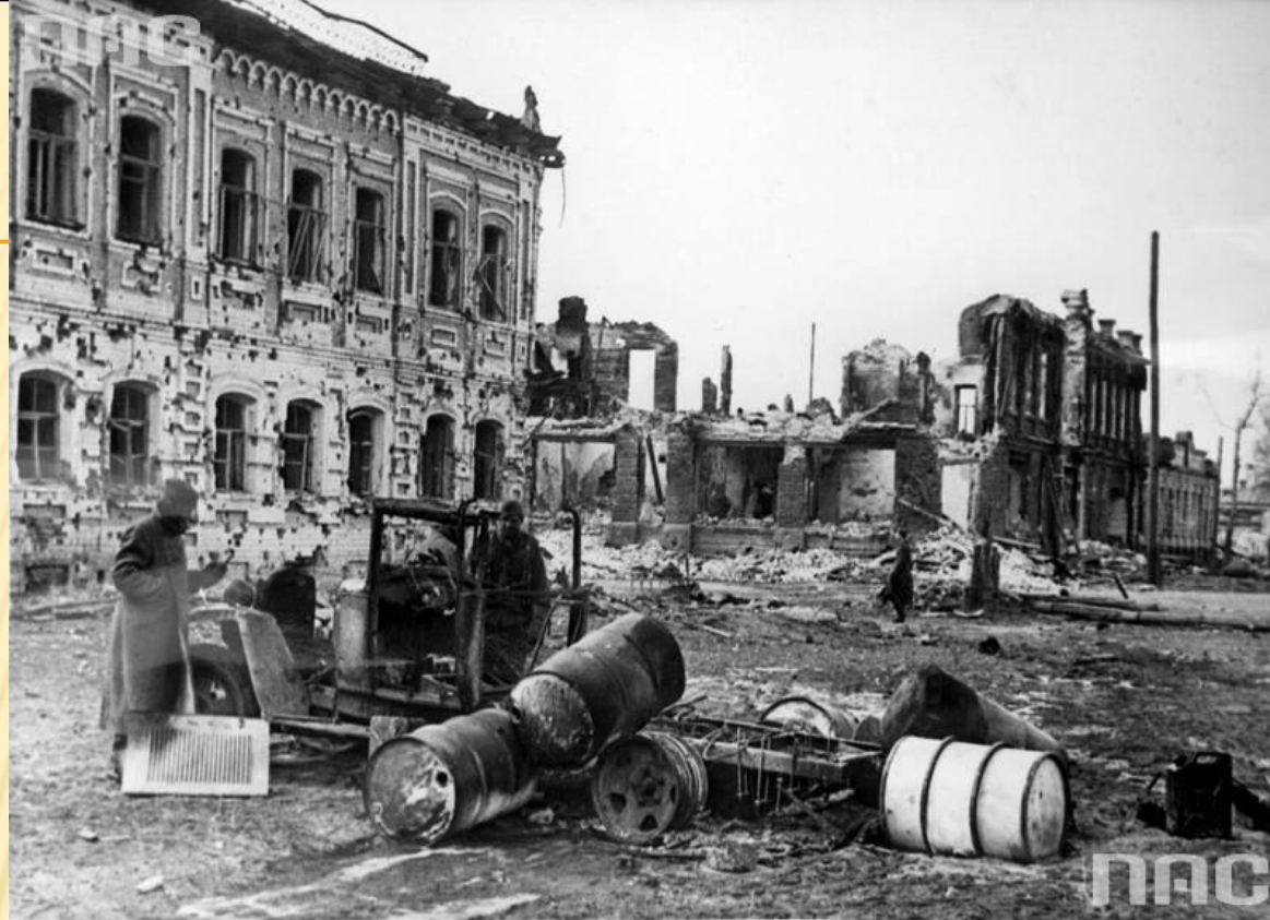
sygn. 2-1651