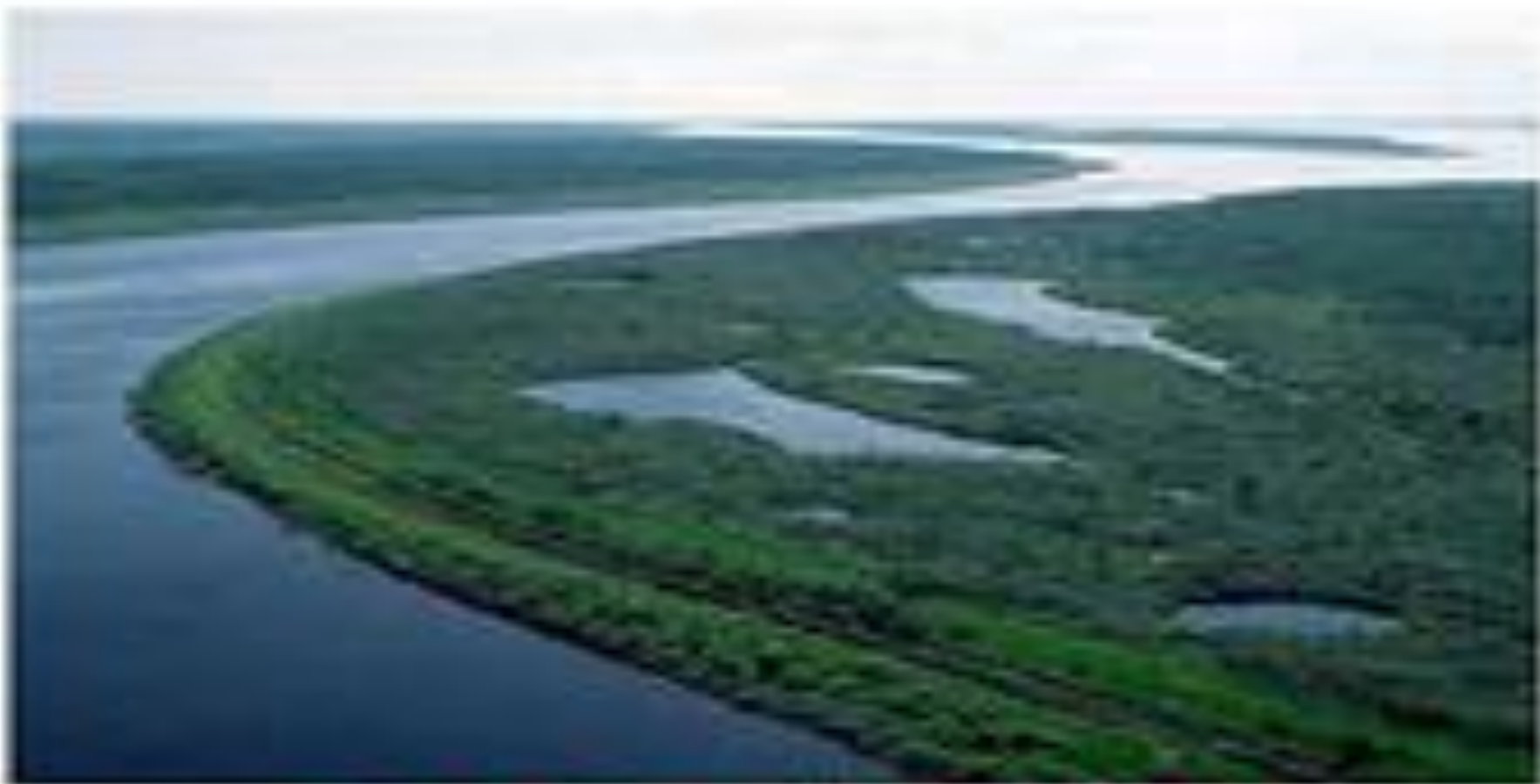
Река Енисей, Россия