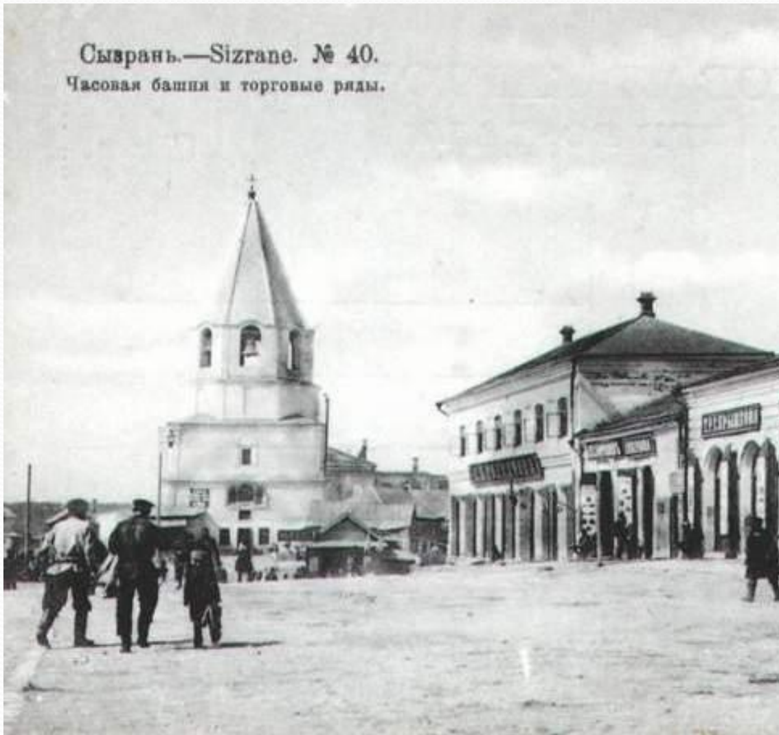
Сызрань.—Sizrane. № 40. Часовая башня и торговые ряды.

Город Сызрань был основан в 1683 году воеводой Григорием Козловским. Царь поручил ему набрать полк, двинуться к Самарской луке и заложить крепость на реке Сызранке.