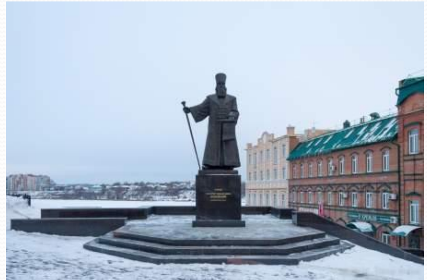
Памятник воеводе Козловскому

В Сызрани есть свои достопримечательности.