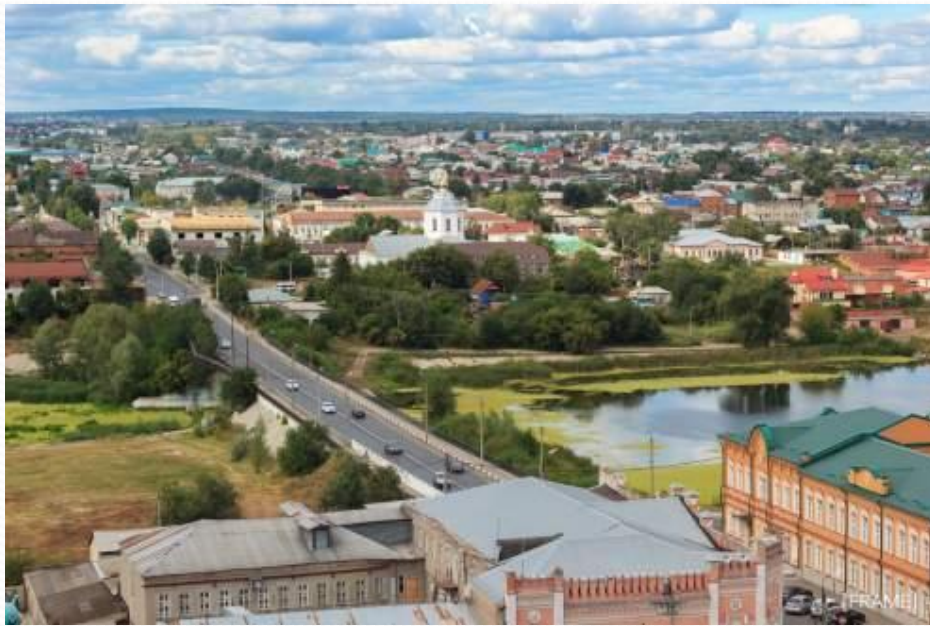
Река Крымза. Краеведческий музей.