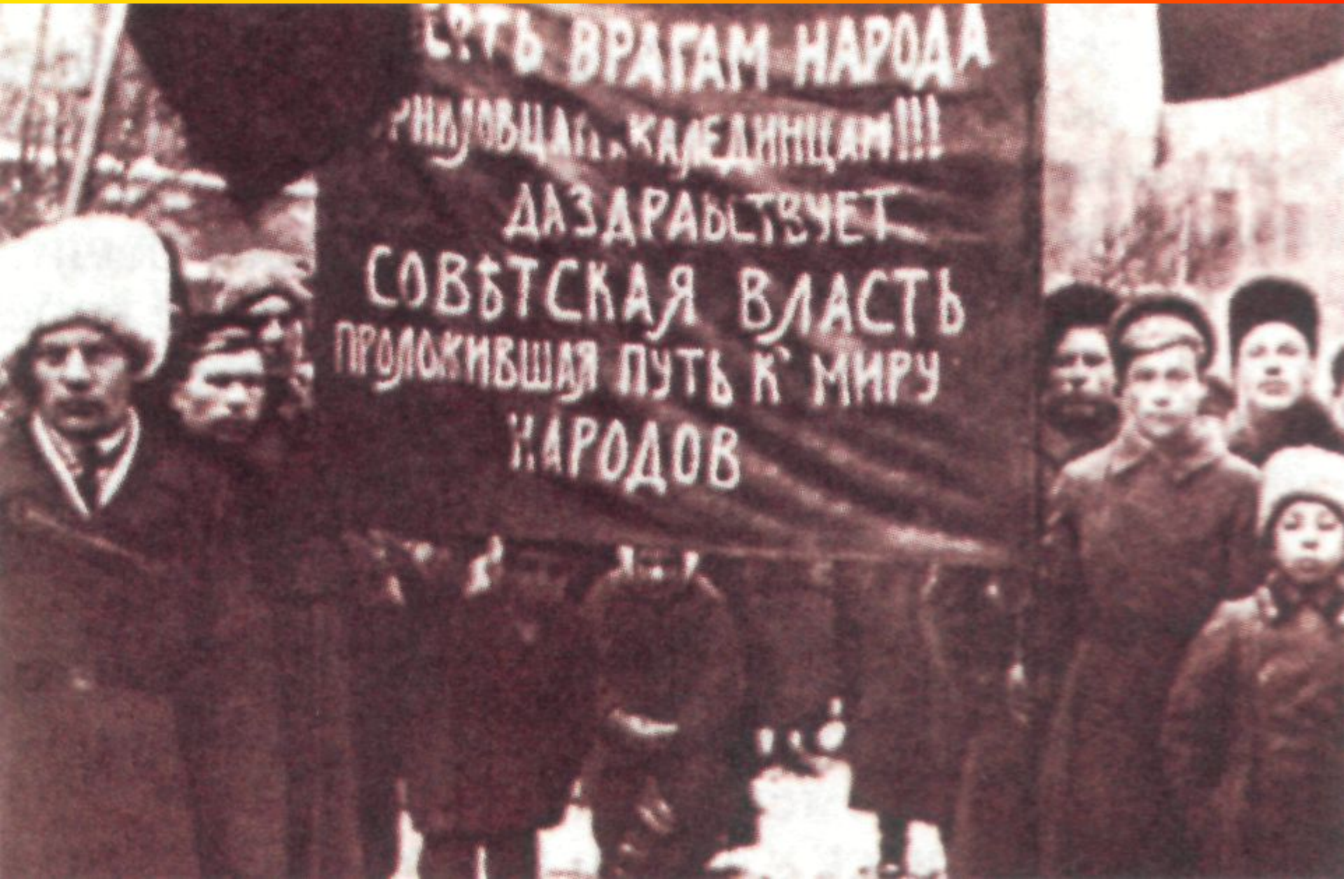
Демонстрация в поддержку советской власти. Петроград. Фотография. 17 декабря 1917 г.