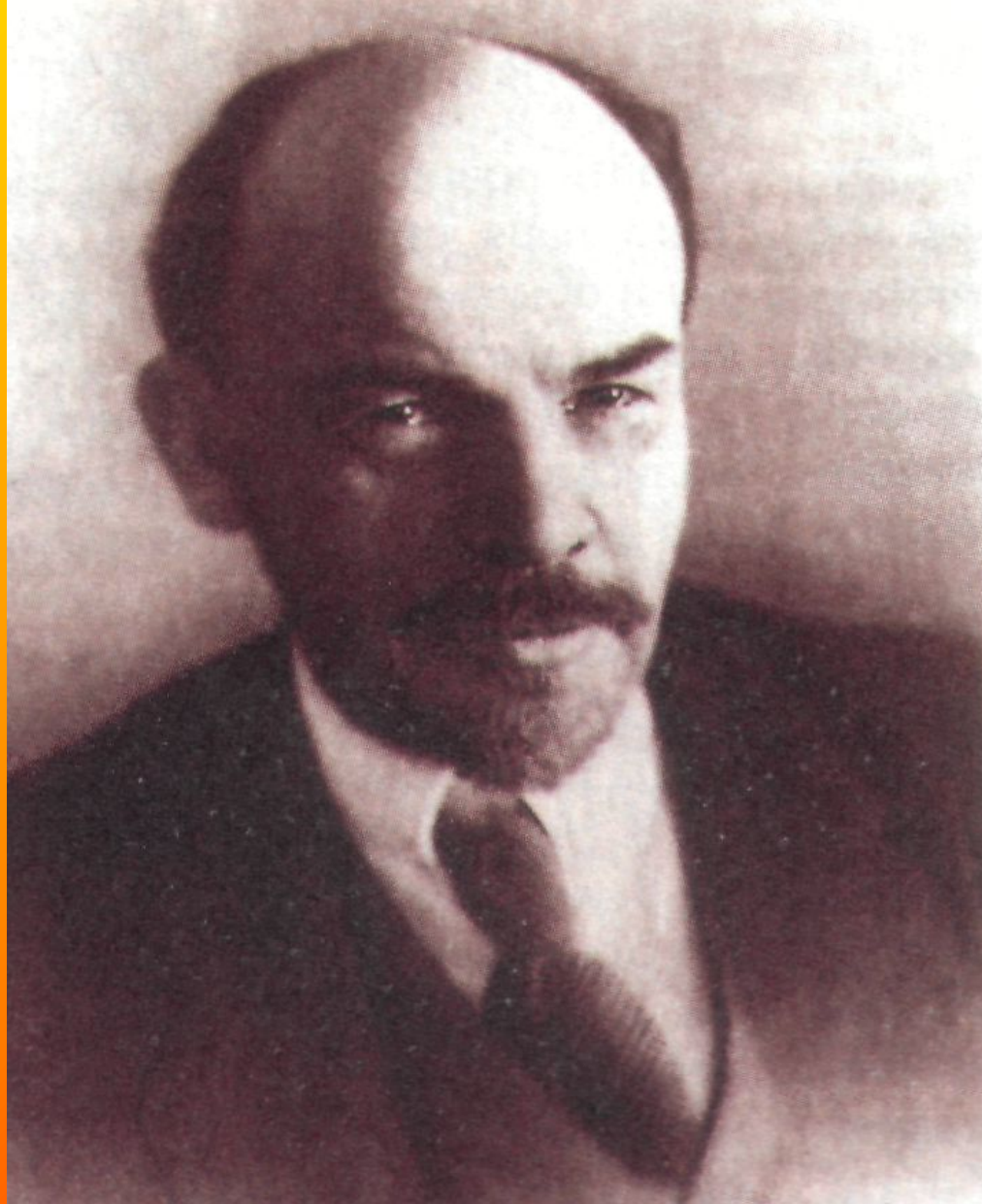
Ленин Владимир Ильич