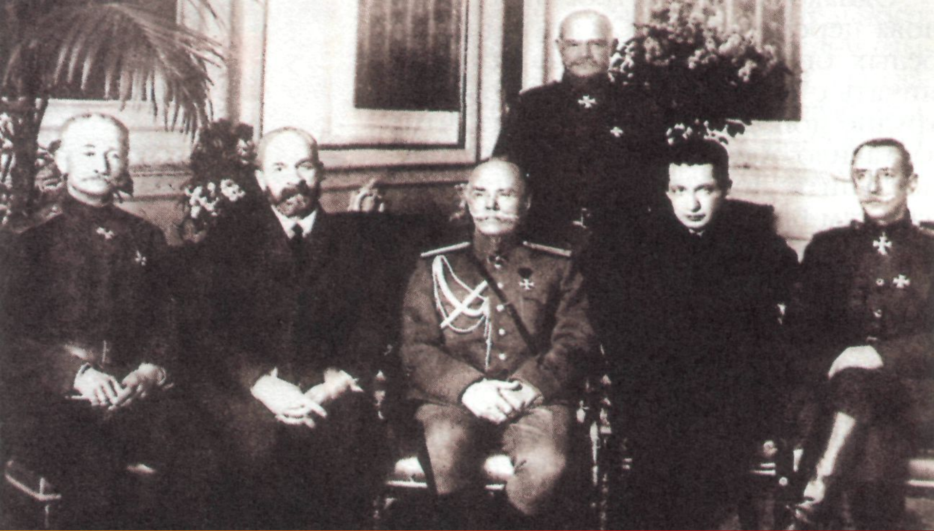
Члены Временного правительства (слева направо) А. Брусилов, Г. Львов, М. Алексеев, А. Керенский. Фото. 1917 г.