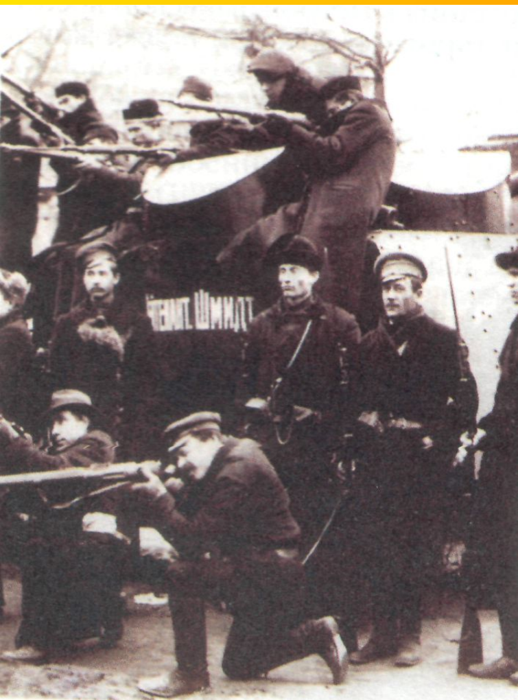
Восставшие в Петрограде захватили броневик войск Временного правительства. Фотография. Октябрь 1917 г.