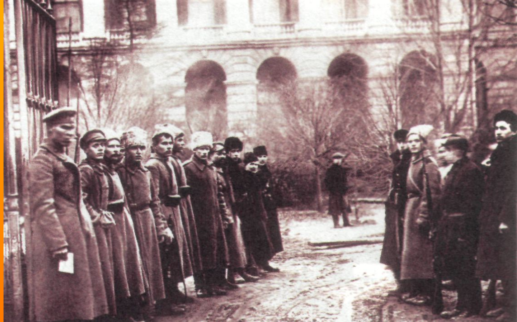
Красногвардейцы и революционные солдаты в карауле перед Смольным. Фотография. Осень 1917 г.