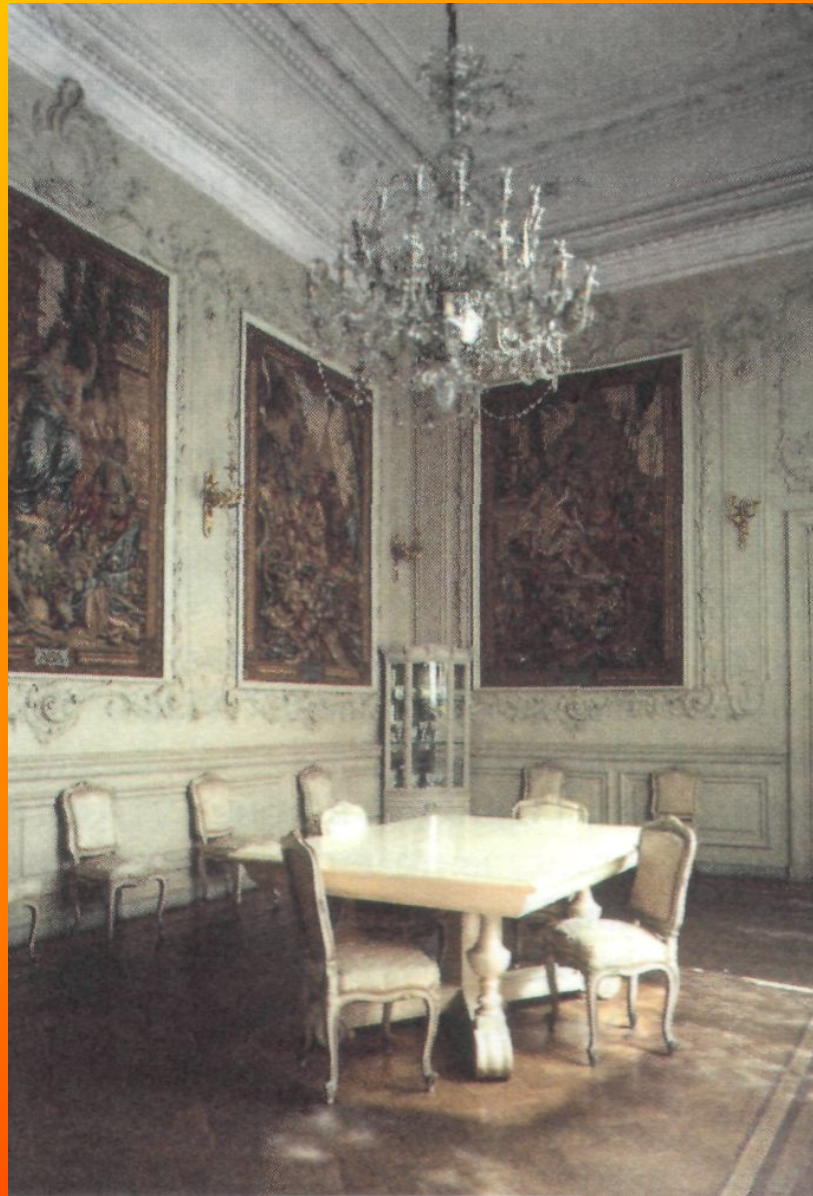
Комната, где было арестовано Временное правительство. Зимний дворец. Фотография.