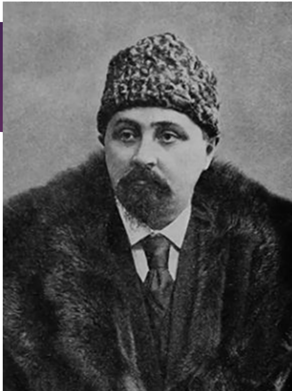
Дмитрий Наркисович Мамин-Сибиряк