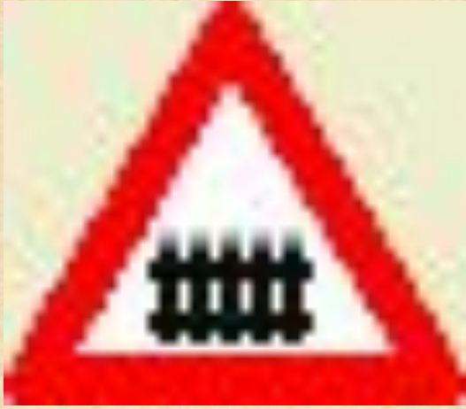
Железнодорожный переезд со шлагбаумом