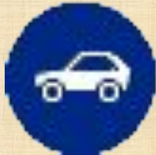
Движение легковых автомобилей