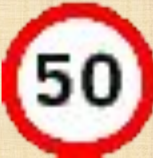
Ограничение максимальной скорости