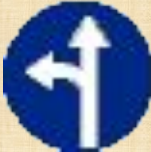
Движение прямо или налево