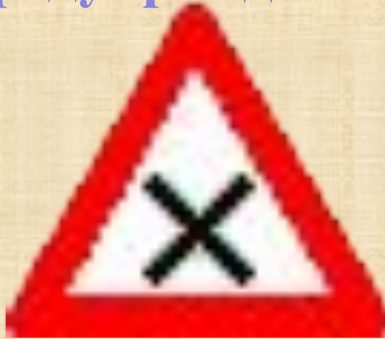
Пересечение равнозначных дорог