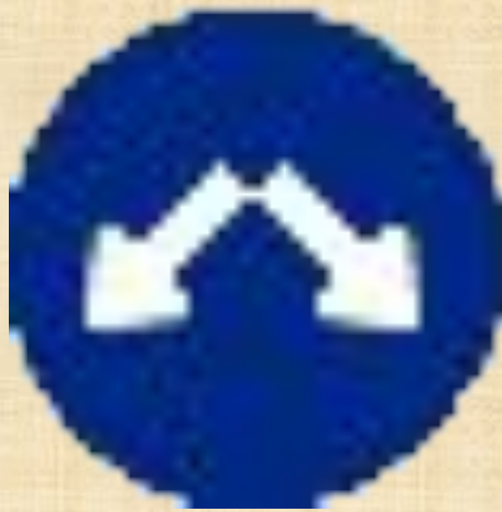
Объезд препятствия справа или слева