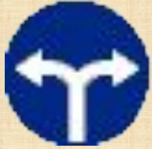
Движение направо или налево