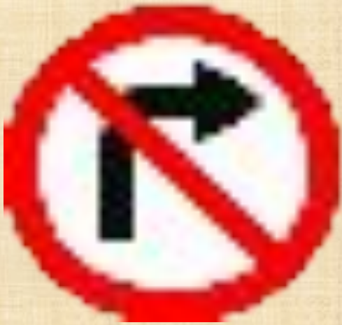
Поворот направо запрещен