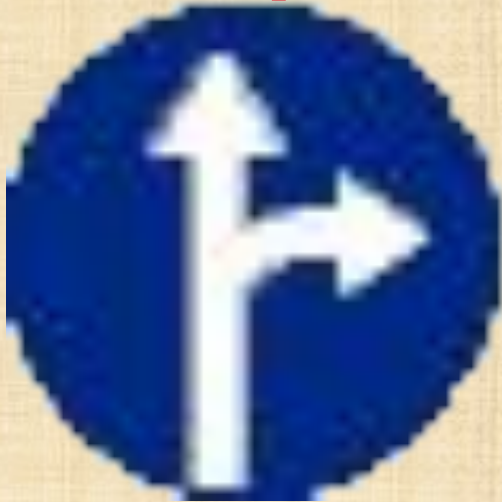
Движение прямо или направо