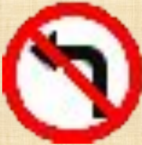
Поворот налево запрещен