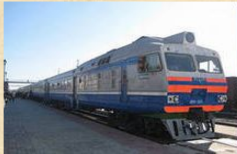
наземный вид рельсового транспорта