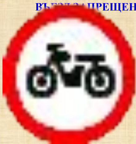
Движение мотоциклов запрещено