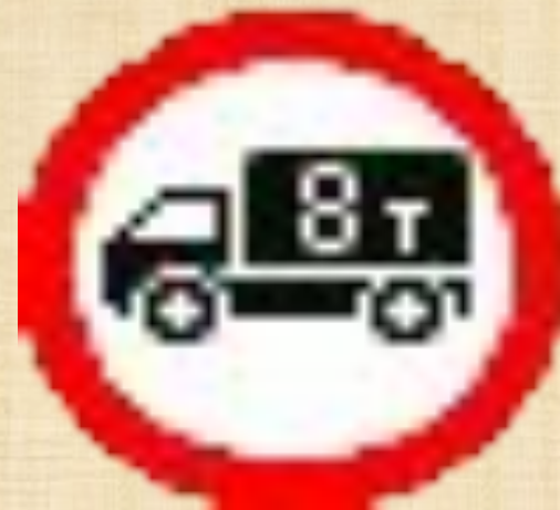
Движение грузовых автомобилей