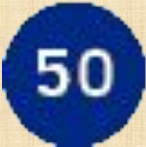
Ограничение минимальной скорости