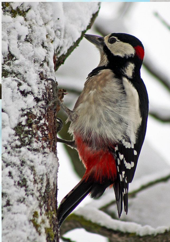
Большой пёстрый дятел