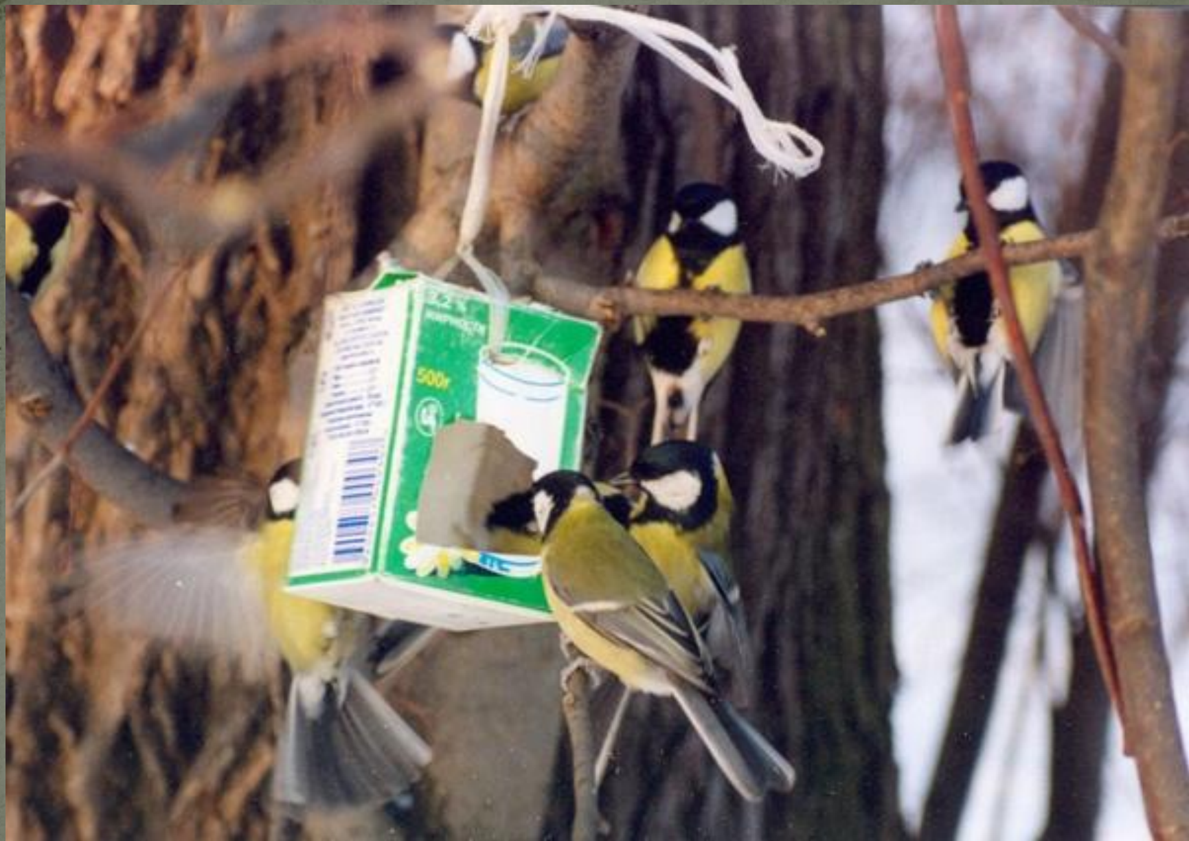
Перед стайкою синиц.