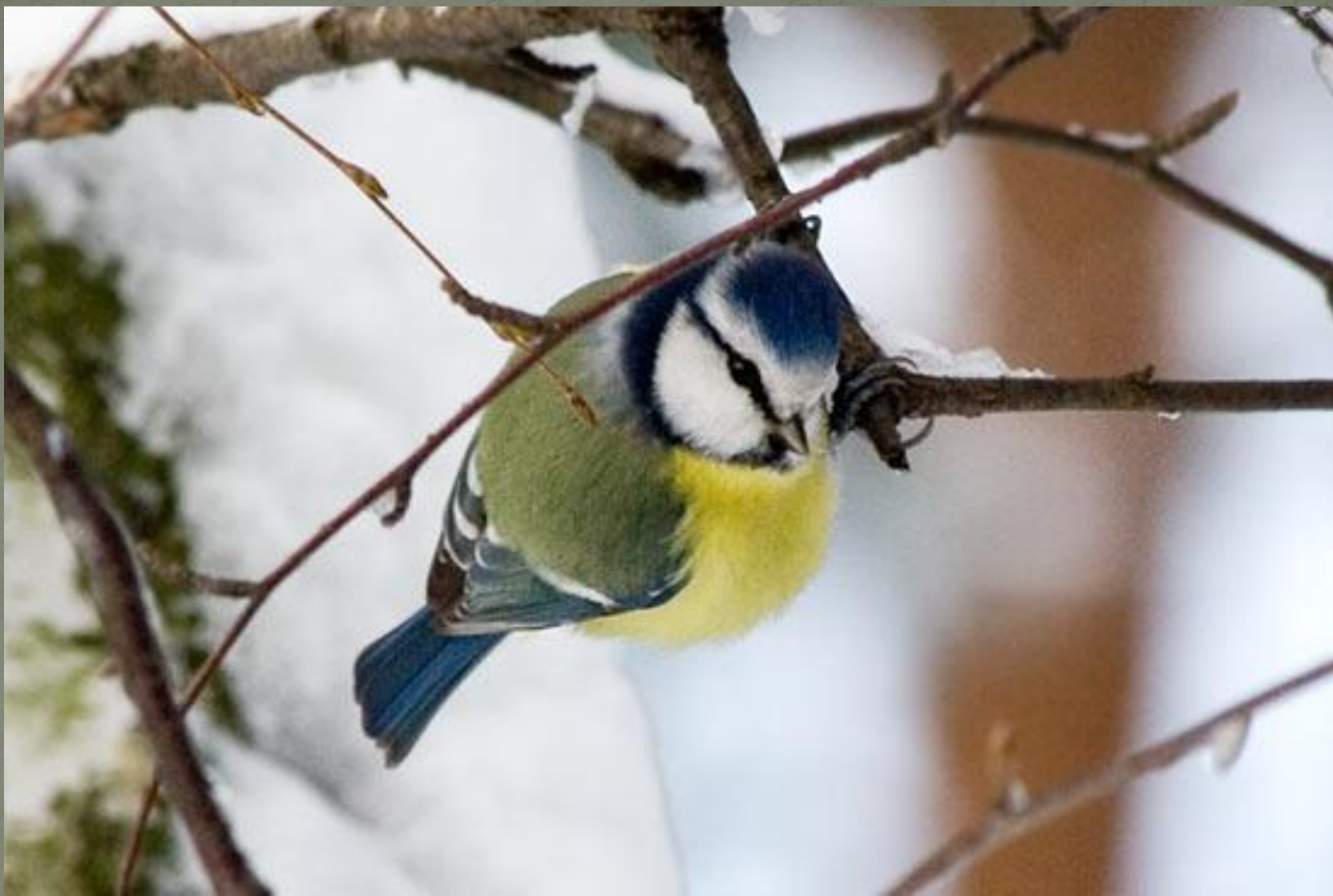
Красивая синичка – лазоревка.