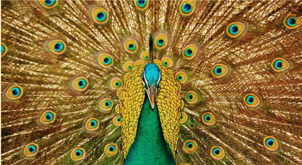
Павлин Тропический лес