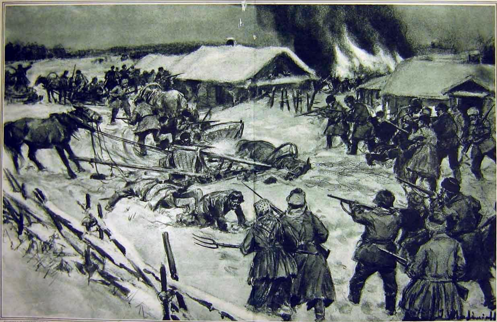
Illustration by John Whistler, of Petersburg.