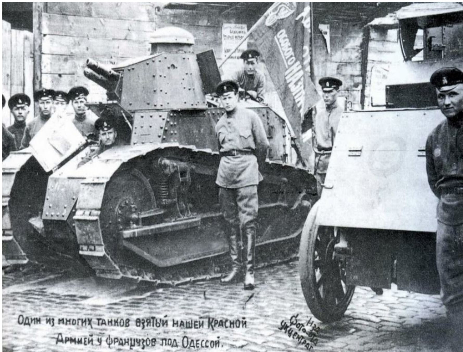
Один из многих танков взятый нашей Красной Армией у французов под Одессой.