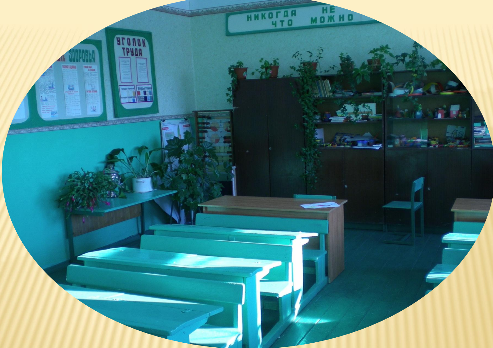
Кабинет №11 – 39 растений.