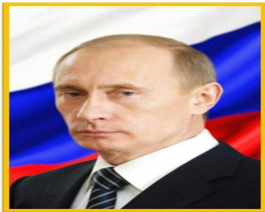
Путин Владимир Владимирович