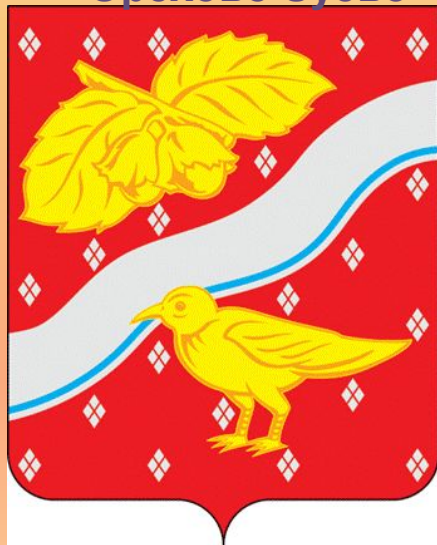
Герб городского округа Орехово-Зуево