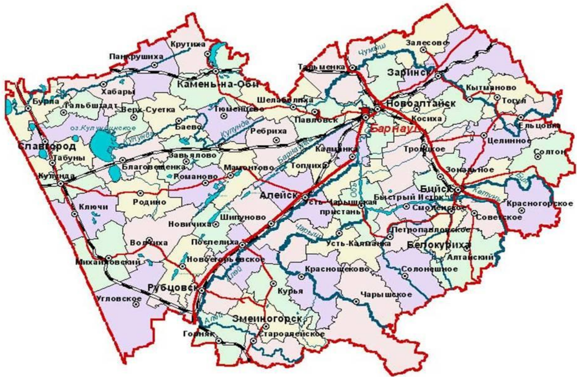
■ КАРТА АЛТАЙСКОГО КРАЯ