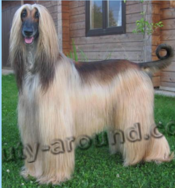
Афганская борзая (афган)