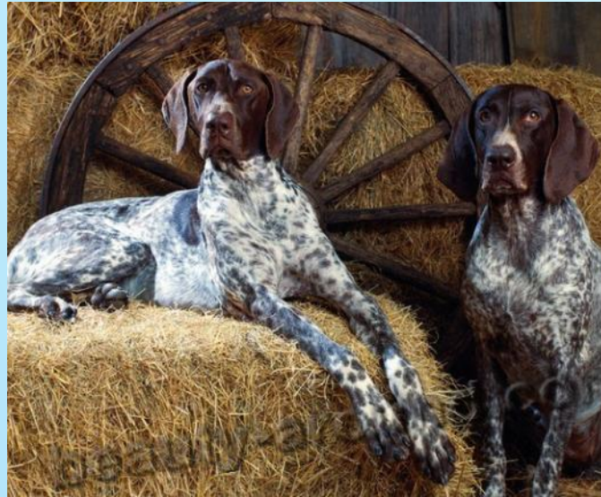
Курцхаар (немецкий пойнтер)