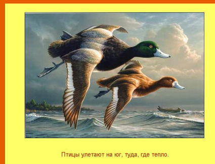
Птицы улетают на юг, туда, где тепло.